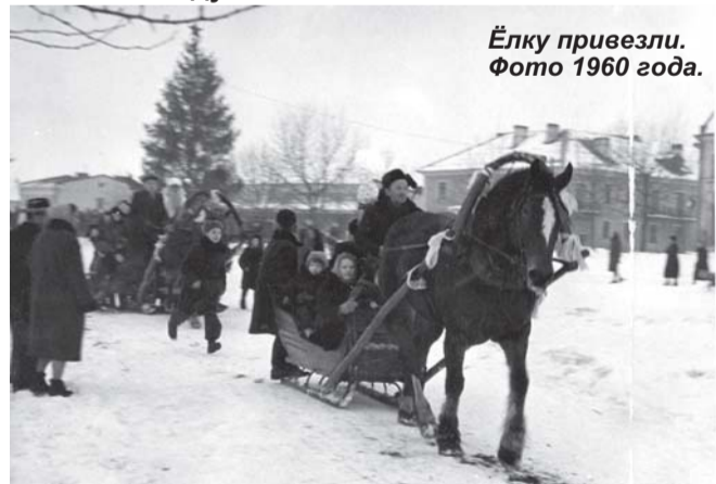
Ёлку привезли. Фото 1960 года.

В прочем, не так уж и давно стали отмечать Новый год так широко и безудержно, как знакомо нам. Предлагаем вашему вниманию небольшую подборку фотографий из истории празднования Нового года в Приозерске в 1960 году.