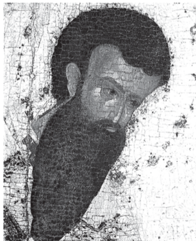
Часть иконы из деисусного ряда иконостаса Благовещенского собора Московского Кремля. Работа Феофана Грека. 1405 (?)

А у нас сейчас укрепились астрологические прогнозы, обязательные в каждой газете, да ещё каждый год почему-то называется согласно китайскому календарю.