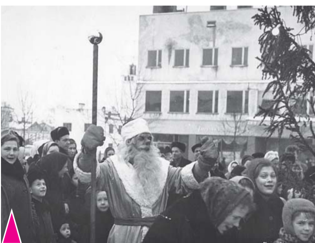
Новый год на площади г. Приозерска. 1960 год.

А вот о трудовых успехах писали много. На первой странице этой же газеты есть картинка, которая вполне вписывается в описание достижений сельских тружеников Приозерского района. Новый 1961 год въезжает на тройке, которая состоит из свиньи, коровы и овцы - главных кормильцев района. Новый год предстаёт в образе молодого задорного юноши, позади него в санках лежат мешки и бочки, наполненные молоком, мясом, салом и шерстью, добытыми в уходящем году сверх плана.