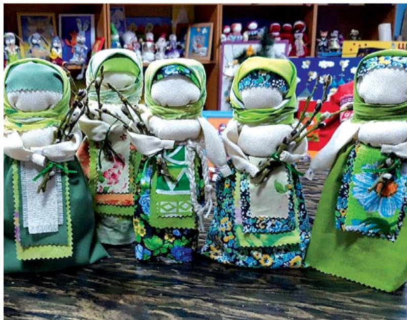
Народные куклы Ирины Дьяченко и ее подопечных из Образцового самодеятельного коллектива «Страна мастеров».

Людмила БОРИСОВА Фото предоставлены автором