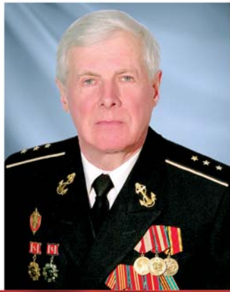
Жена, дети, внуки, родные, друзья

Поздравляем с прекрасным юбилеем и желаем здоровья и бодрости, глубокого уважения окружающих и понимания близких, заботы и тепла родных, семейного блага и счастья, душевного спокойствия и светлых, радостных моментов.