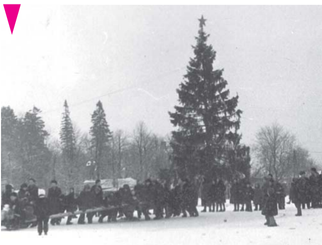
Встреча Нового года в Доме культуры Приозерского целлюлозного завода.