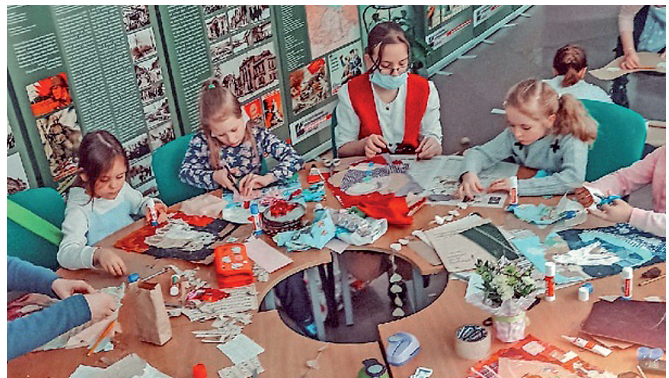
На одном из занятий в клубе «Имажинисты».

Не устаешь удивляться, сколько талантливых и замечательных людей живет в нашем городе! Если ребенок вприпрыжку бежит на кружок, если вместо компьютерных игр он предпочитает работать над своим проектом, если у него