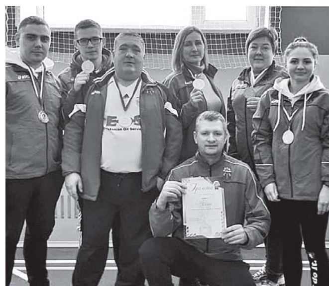
Команда администрации Мельниковского поселения.

В преддверии 8 Марта самые активные и спортивные жители Мельниковского сельского поселения приняли участие в Дне здоровья, приуроченном к Международному женскому дню. Он проходил на территории местной школы, предоставившей свои спортивные площадки для любителей физкультуры и спорта.