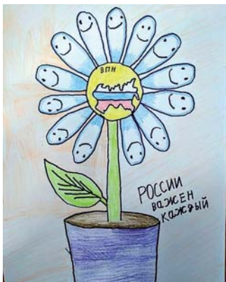
Илья, 9 лет, Республика Алтай.

Более 4 тысяч работ пришло на конкурс детского рисунка, посвященный Всероссийской переписи населения. Увидеть и оценить все работы россияне смогли на официальном сайте ВПН strana2020.ru с 3 марта.