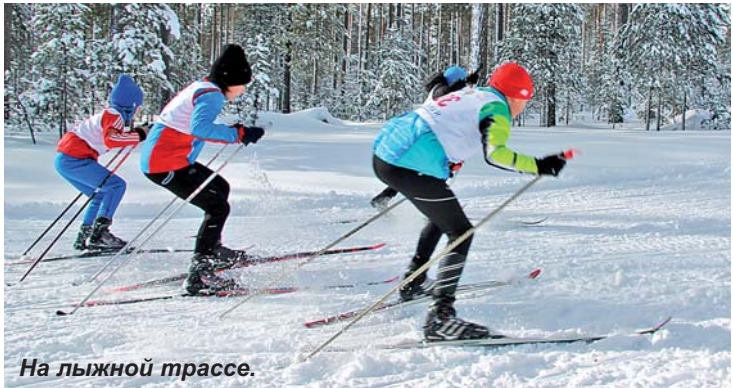
На лыжной трассе.

В поселке Петровское состоялись первые соревнования в рамках 7-й православной спартакиады Выборгской епархии. В них приняли участие 29 человек из г. Приозерска, п. Мельниково, п. Петровское и п. Сосново. Состязания прошли по биатлону среди детей и взрослых, на хорошей трассе, подготовленной местными активистами спорта. Им выражаю очередную благодарность за содействие!