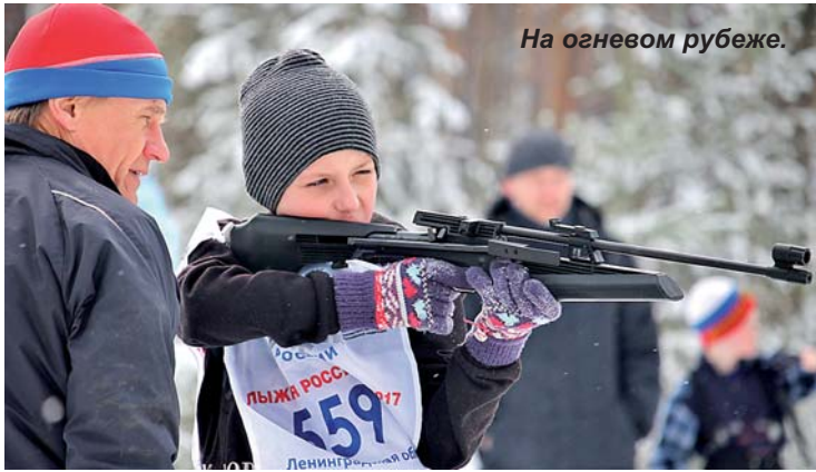
На огневом рубеже.

В поселке Петровское состоялись первые соревнования в рамках 7-й православной спартакиады Выборгской епархии. В них приняли участие 29 человек из г. Приозерска, п. Мельниково, п. Петровское и п. Сосново. Состязания прошли по биатлону среди детей и взрослых, на хорошей трассе, подготовленной местными активистами спорта. Им выражаю очередную благодарность за содействие!