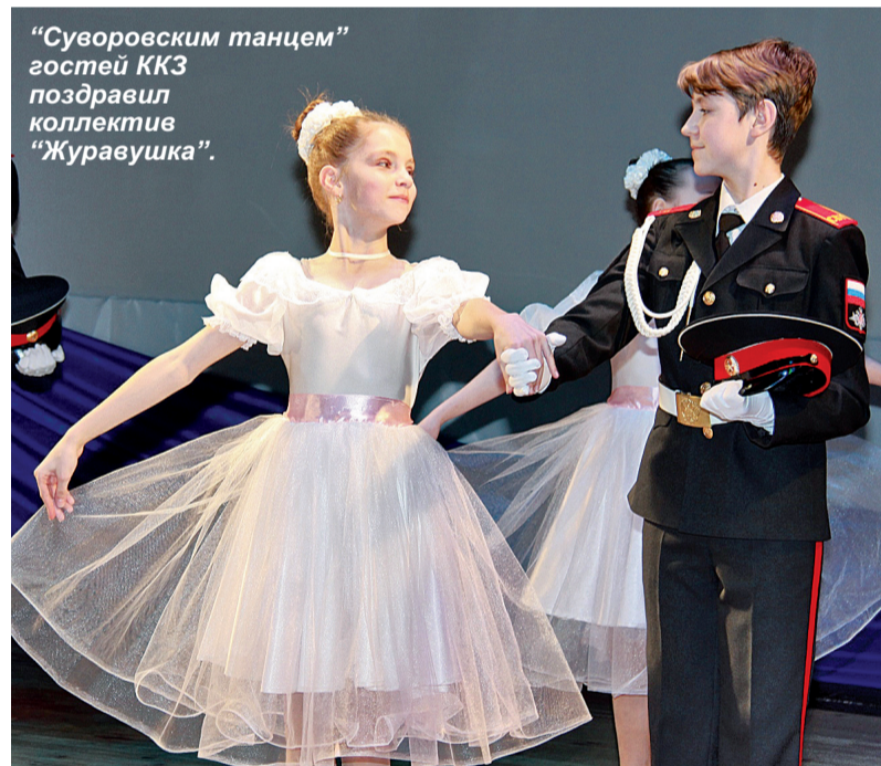
«Суворовским танцем» гостей ККЗ поздравил коллектив «Журавушка».