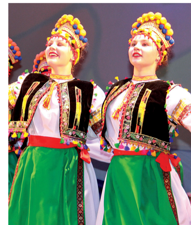
«Гуцульский танец» (коллектив «Журавушка»).