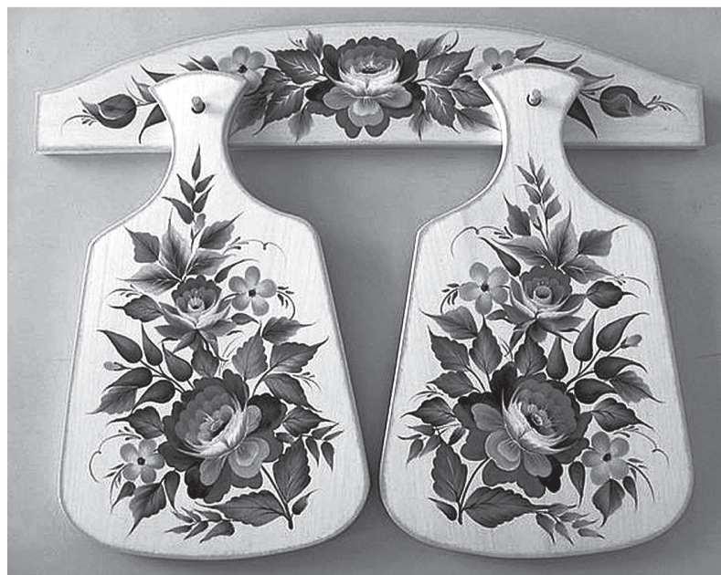
Цветочная роспись на разделочных досках.