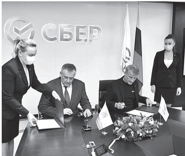
Соглашение о сотрудничестве подписали губернатор Ленинградской области Александр Дрозденко (слева) и президент, председатель правления Сбербанка Герман Греф.

Отдельно губернатор Ленинградской области и глава Сбербанка договорились о поддержке малого и среднего бизнеса в регионе. Речь идет как о финансово-кредитной поддержке, развитии в Ленинградской области госпрограмм поддержки предпринимательства, так и об организации консультаций и семинаров для бизнеса.