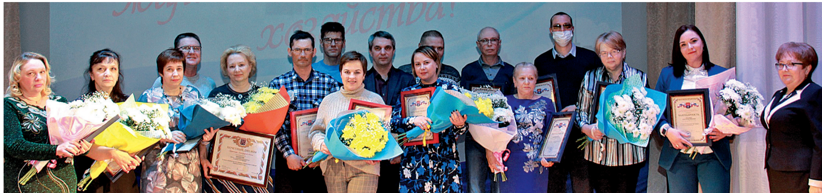
Работникам ЖКХ были вручены благодарности Минстроя и ЖКХ РФ, почетные дипломы и почетные грамоты губернатора Ленобласти, почетные грамоты и благодарности главы администрации МО Приозерский муниципальный район.

В канун профессионального праздника - Дня работников бытового обслуживания населения и жилищно-коммунального хозяйства - 19 марта лучших руководителей, специалистов, рабочих и ветеранов отрасли поздравляли в Приозерском киноконцертном зале. Здесь состоялось торжественное мероприятие в их честь.