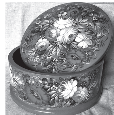
Шкатулка с крышкой.

Это делается для того, чтобы краска не впитывалась в древесину матрешки и не расплывалась по ней. После того как грунтовка высохла, наносится контур рисунка. Пока заготовка сохнет, можно подготовить эскиз. Для того чтобы матрешка получилась симметричной, отмечается середина каждой матрешки: на заготовке проводится вертикальная линия от макушки до пят. После чего эскиз переносится на деревянную заготовку. Карандашом рисуют овал лица, основные части и детали одежды. После этого заливаются крупные цветочные пятна - обычно это сарафан, платок и рубашка (чаще используют акрил, акварель, гуашь). Наконец, начинается детальная проработка рисунка: тщательно прорисовываются лицо и декор на одежде. После окончания росписи матрешку лакируют, чтобы закрепить рисунок, придать игрушке яркость и приятный глянец. Традиционный вариант: матрешки расписывают красным, зеленым, синим и их сочетаниями - желтым, оранжевым.