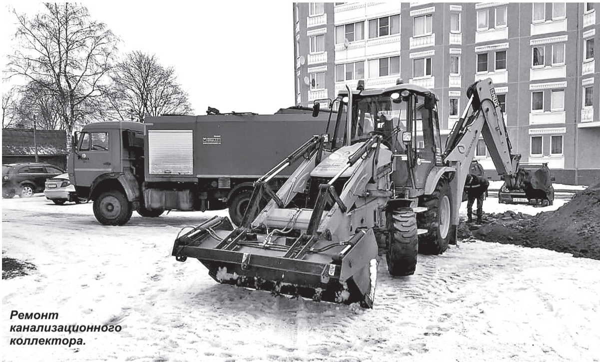
Ремонт канализационного коллектора.