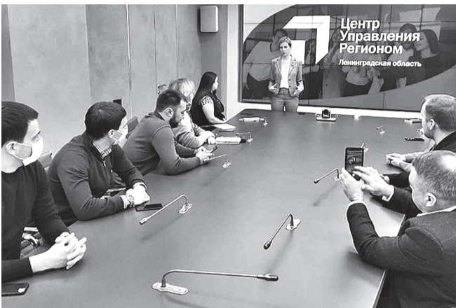
Обращения поступают в единый центр - комитет общественных коммуникаций региона - и направляются ответственным для ответа.

С начала работы решено 5067 вопросов, 4649 из них - в срок до 10 дней. Остальные обращения в работе. Тематика очень разнообразна: от записи на вакцинацию в Лужском районе до попытки придомовой территории песком в Бокситогорске, от получения справки о наличии транс-