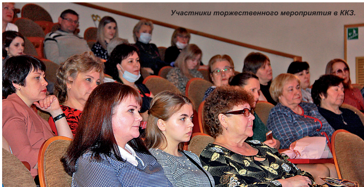
Участники торжественного мероприятия в ККЗ.