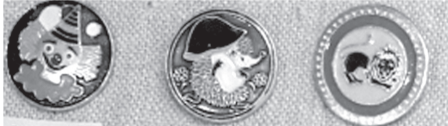
Фрагмент выставки значков.