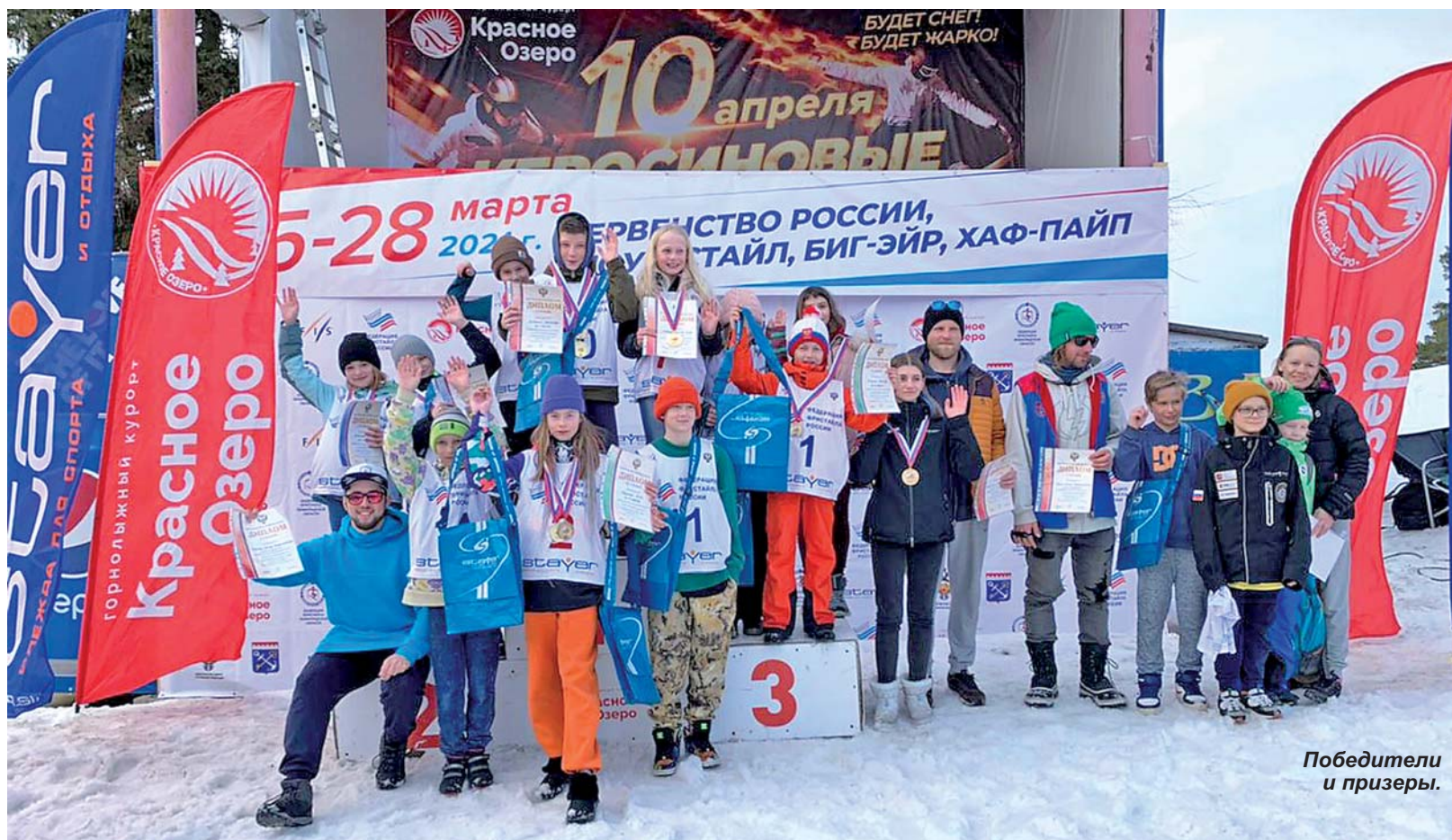
Победители и призеры.

- В этом году выступления спортсменов на «Красном озере» начались в конце февраля, когда здесь состоялся 3-й этап Кубка России