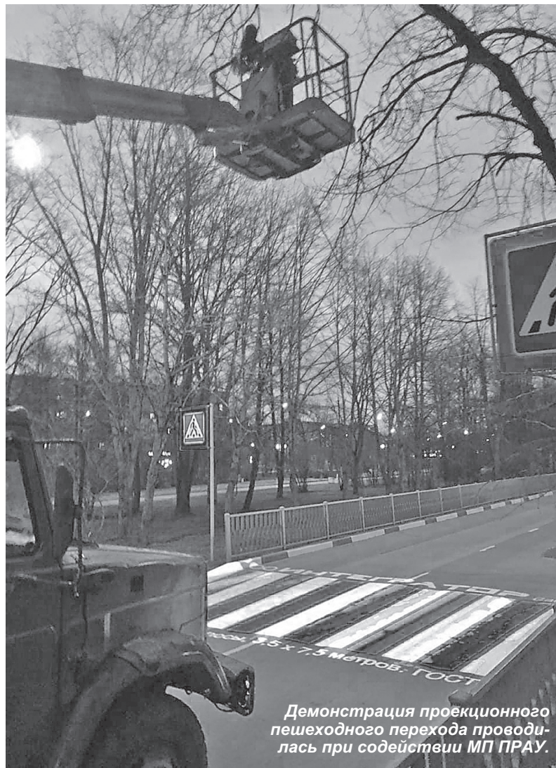
Демонстрация проекционного пешеходного перехода проводилась при содействии МП ПРАУ.