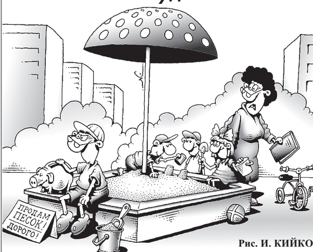
Рис. И. КИЙКО