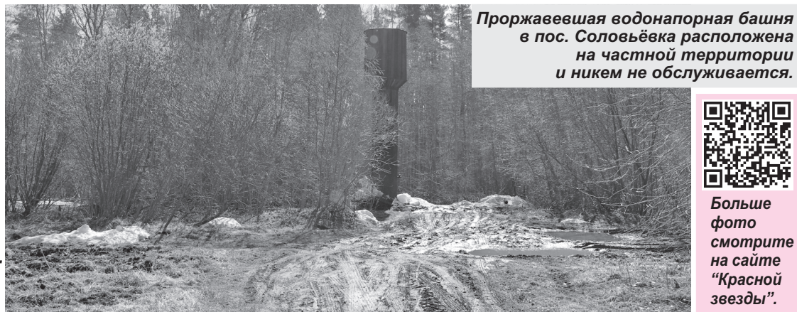
Проржавевшая водонапорная башня в пос. Соловьёвка расположена на частной территории и никем не обслуживается.

В редакцию «Красной звезды» позвонили жители домов №№ 102 и 104 на ул. Центральной пос. Соловьёвка и сообщили, что в единственной колонке рядом с ними нет воды. Более десятка лет она толком не работала, а теперь воды вообще нет несколько дней. В двух муниципальных двухэтажных домах проживает более 20 семей. Вода из вырытого рядом колодца непригодна для питья и после набора нескольких вёдер становится мутной. В администрации Плодовского поселения пояснили, что предполагаемая причина сбоя - сломавшийся насос водонапорной башни, и без воды остались также собственники частных домов, которые пользовались водоводом.