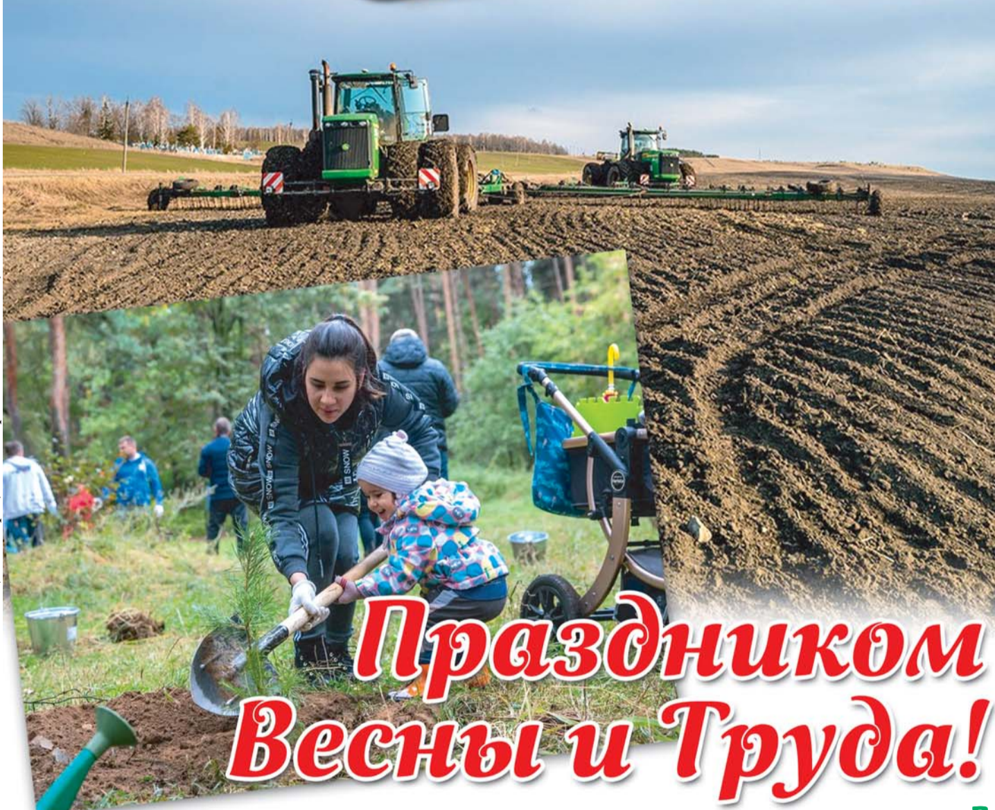
Фотоколлаж А. ТЮРИНОЙ (иллюстрации из открытых источников)