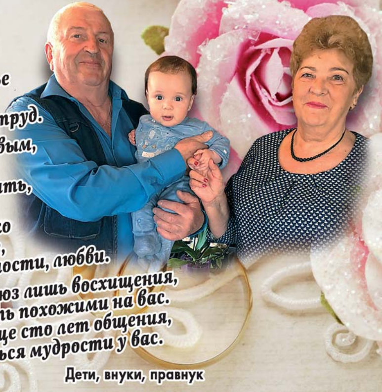
Дети, внуки, правнук

55 лет любви и понимания, И ваши чувства - чистый изумруд, Ведь сохранить в семье любовь, внимание - Довольно кропотливый труд. Всегда быть и заботливым, и честным, Знать, где и промолчать, где отойти, Ведь может только искреннее сердце, Полно в котором нежности, любви. Достоин ваш союз лишь восхищения, Хотят все быть похожими на вас. Желаем вам еще сто лет общения, Чтобы учиться мудрости у вас.