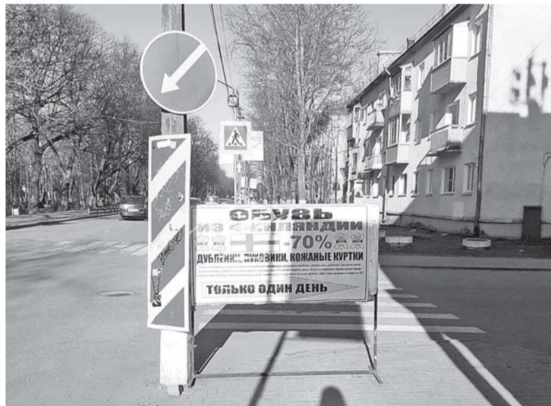
Рекламная конструкция на перекрестке улиц Калинина и Жуковского в Приозерске (снимок сделан 17 апреля около 18 часов).

- Да это возмутительно! Среди бела дня в центре города заезжие дельцы ведут себя как хозяева территории: устанавливают, что хотят и где хотят! - не сдержалась пожилая женщина, пытавшаяся перейти улице Жуковского с двумя мальчишками, наверное, внуками, у каждого из которых было по велосипеду. Ребятишки, юрко лавируя между баннером и припаркованными с другой от него стороны автомобилями, кстати, соблюдали Правила дорожного движения и переходили «зебру», спешившись и везя своих желез-