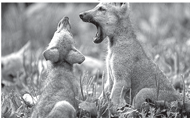
ВОЛЧАТА в мае еще беспомощны и находятся все время в логове в лесной глуши, неподалеку от воды. Туда ведет заметный по росе след матерого волка, ежедневно на заре возвращающегося с добычей. Около гнезда валяются кости, слышен запах псины, волчьего помета и гниющего мяса.

ляков длится до 52 дней, у русаков - 43-45 дней.