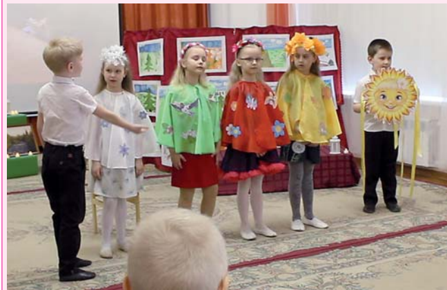
Фрагмент литературного вечера.