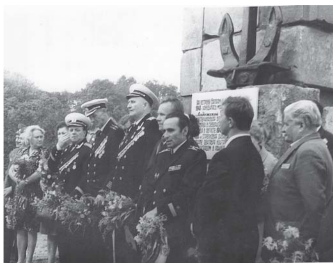
Открытие памятника морякам Ладожской военной флотилии на Валааме. 1975 г.

поправившись, продолжил службу в Главном морском штабе, занимаясь научной деятельностью в области изучения боевого опыта.