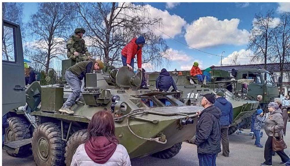
Выставка военной техники на центральной площади Приозерска.