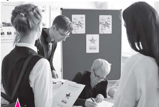
Участники акции в школе № 4 и в Раздольской школе.

(на снимке внизу). Почетных гостей обучающиеся встретили с цветами.