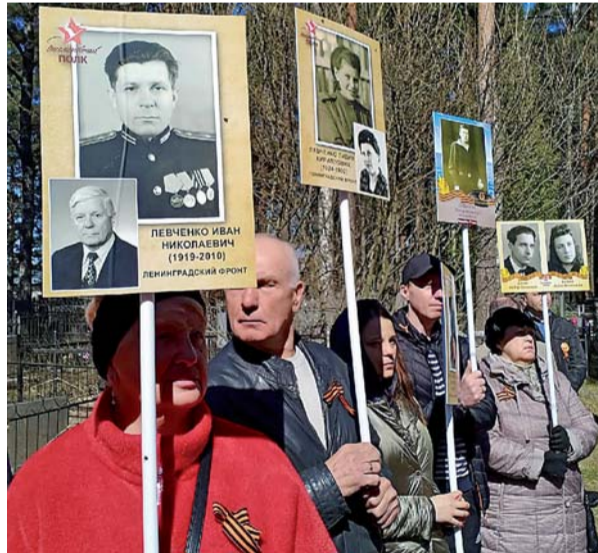
Участники торжественно-траурного митинга с портретами своих героических предков.

Торжественно-траурные митинги прошли у воинских захоронений и памятных мест во всех поселениях Приозерского района.