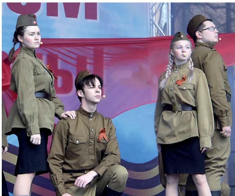
Пролог «Сияй в веках, Великая Победа» в исполнении участников творческих коллективов КЦ «Карнавал» - «Юные звёзды», «Каламбур», «Кураж», «Конфетти» и студентов Приозерского политехнического колледжа.