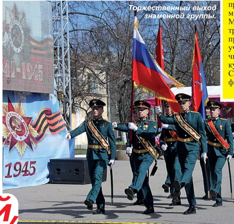
Торжественный выход знаменной группы.