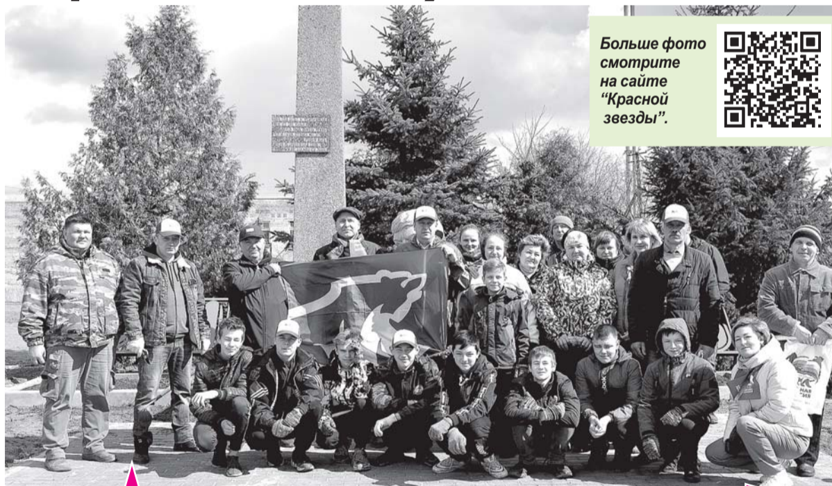
Участники международной акции «Сад памяти» в посёлке Плодовое.

- В нашем поселении осталось всего 9 ветеранов - живых свидетелей тех великих и страшных лет. Наша миссия сегодня - сохранить