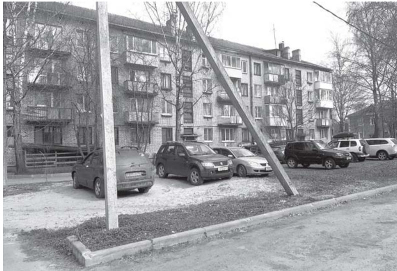
После ликвидации газгольдерной установки во дворе на улице Красноармейской, 8, автовладельцы уже нашли применение освобожденной площадке и без дополнительного благоустройства.