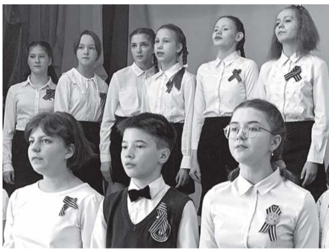
Конкурс «Битва хоров», посвященный Дню Победы.