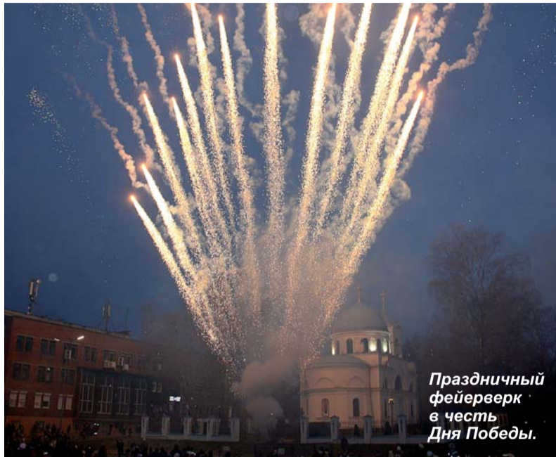
Праздничный фейерверк в честь Дня Победы.