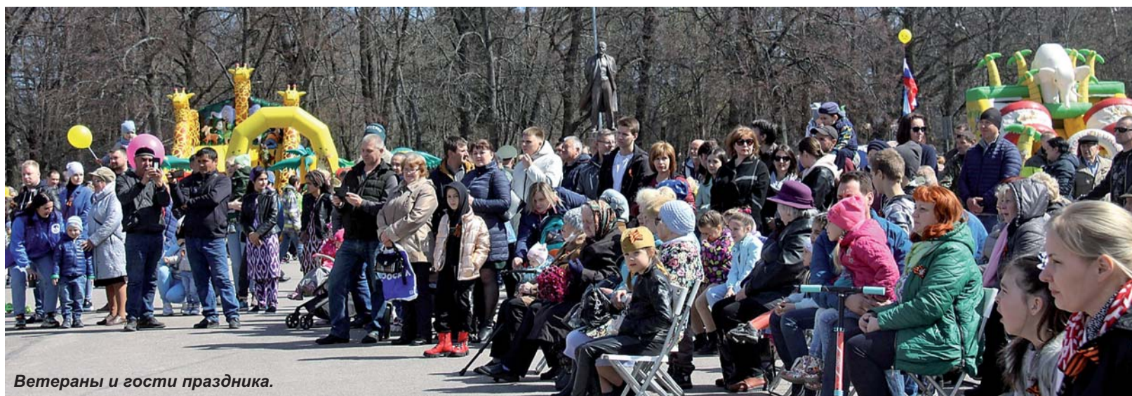
Ветераны и гости праздника.

После возложения основные праздничные мероприятия в честь 76-й годовщины Победы в Великой Отечественной войне развернулись на центральной площади города.