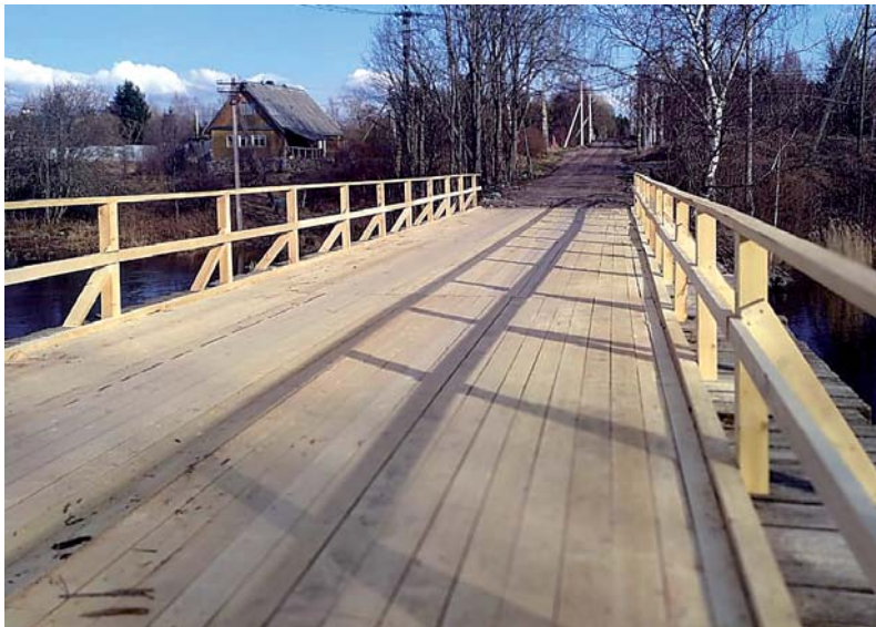
Обновленный мост в п. Горы.

Людмила БОРИСОВА Фото предоставлены автором