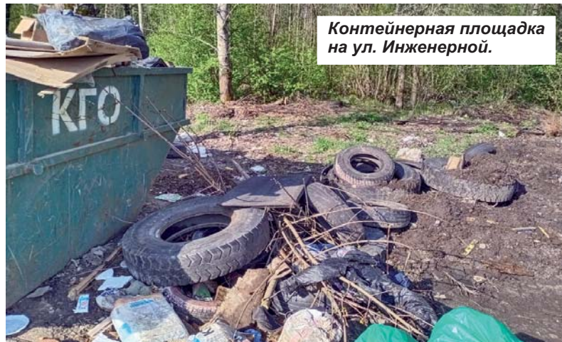
Контейнерная площадка на ул. Инженерной.

Переработка использованных шин не является широкомасштабным бизнесом, но в условиях города или района может стать источником стабильного дохода не только для ПРАУ. Возможно этим заинтересуются представители малого бизнеса. По данным офи-