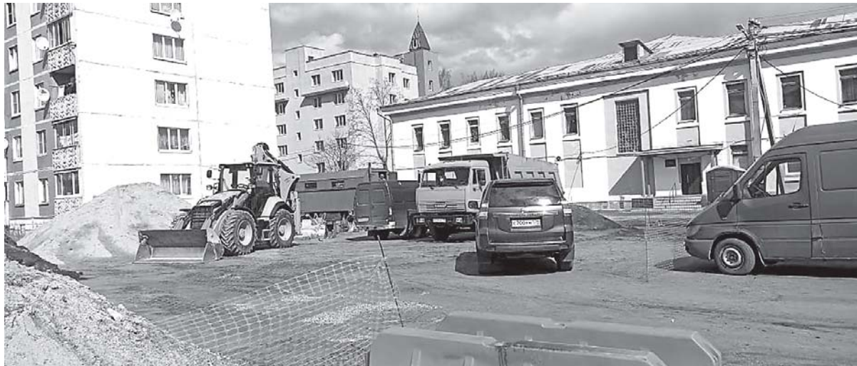
В Сосновском поселении жители выбрали благоустройство дворов в районе улицы Первомайской возле домов №№ 1 и 11, а также улицы Никитина у дома № 6 в пос. Сосново.

В сё большей популярностью в нашем районе пользуется проведение модернизации общественных пространств посредством участия в федеральном национальном проекте «Жилье и городская среда». В этом году начато благоустройство многих территорий в различных поселениях, которые вошли в рамках реализации вышеназванного проекта в областную программу «Формирование комфортной городской среды». Надо отдать должное администрациям этих поселений, сотрудники которых провели большую работу по подготовке нужных документов. А также поблагодарить активных жителей, принявших участие в отборе и голосовании за различные инициативы.