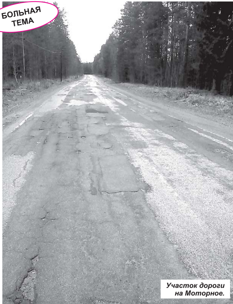
Участок дороги на Моторное.

планирования являются объекты, необходимость ремонта, капитального ремонта и реконструкции которых имеет первоочередное значение для муниципальных районов и Ленобласти в целом: автодороги, входящие в состав международных транспортных коридоров, автодороги, соединяющие центры муниципальных районов с Санкт-Петербургом, автодороги с асфальтобетонным покрытием, находящиеся в аварийно-разрушенном состоянии с высокой интенсивностью движения, в том числе с междугородним автобусным сообщением, на состояние которых поступают мно-