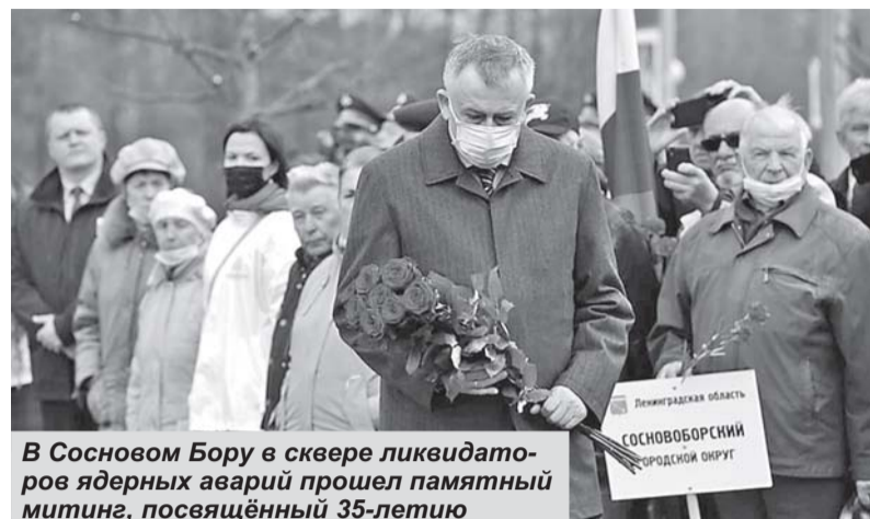
В Сосновом Бору в сквере ликвидаторов ядерных аварий прошел памятный митинг, посвященный 35-летию со дня чернобыльской катастрофы. В нём принял участие губернатор Ленинградской области Александр Дрозденко (вверху).

Всего из Соснового Бора ликвидировать последствия аварии в Чернобыль отправились 1360 че-