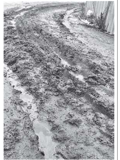
Состояние подъезда к домам №№ 24, 24-а, 26-б и 26-в по улице Ленинградской после аварийной ситуации.

Год назад жители домов №№ 24, 24-а, 26-б и 26-в по улице Ленинградской в поселке Сосново нардоваться не могли на новую подъездную дорогу к своим участкам, которая была оборудована силами администрации Сосновского поселения.