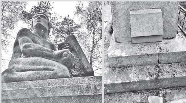
На снимках: памятник финским участникам противостояния «белых» и «красных».