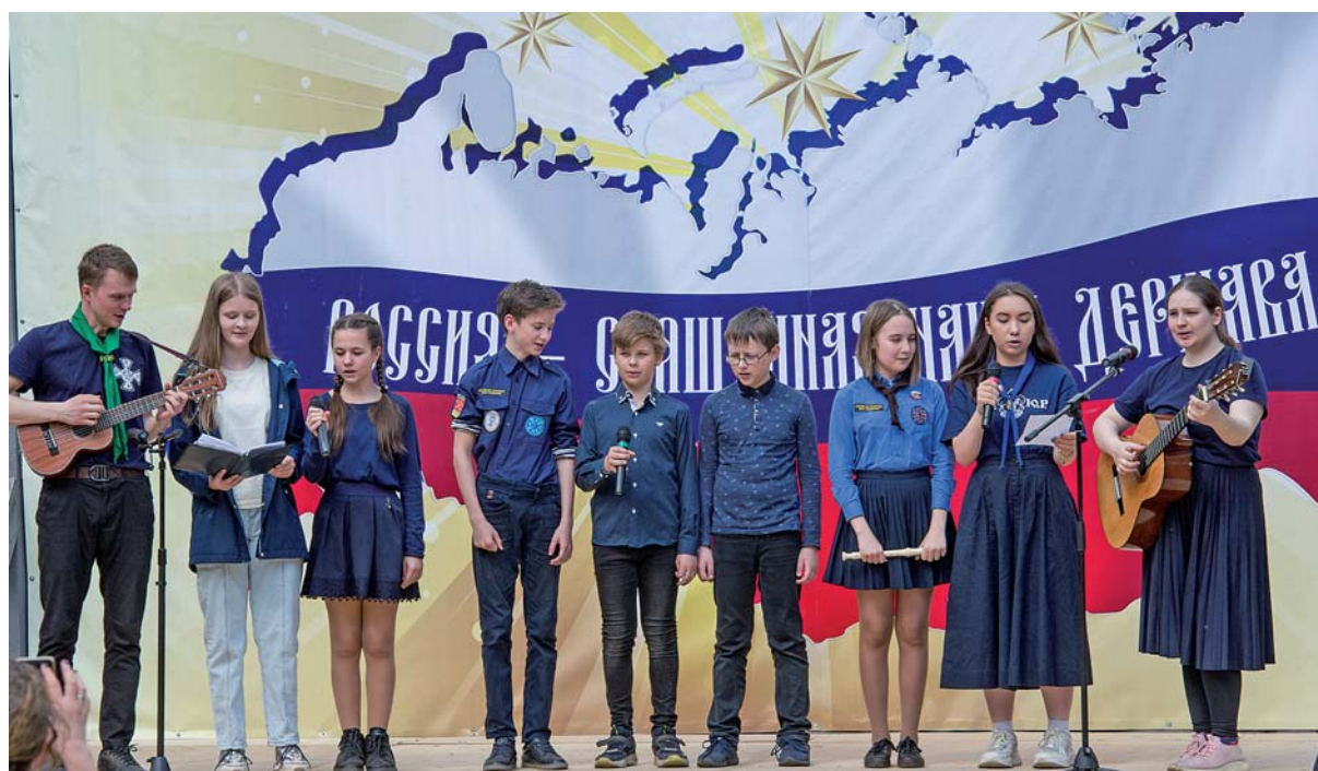
Открытый муниципальный фестиваль детско-юношеского и молодёжного творчества

- Ставя примером образ семьи последнего российского императора, любовь царственных мучеников друг к другу, к ближним, всему российскому народу и своей Родине, мы учим детей и молодежь стремлению к высшим идеалам добра и любви к Отечеству. Одно из решений этой задачи - проявление