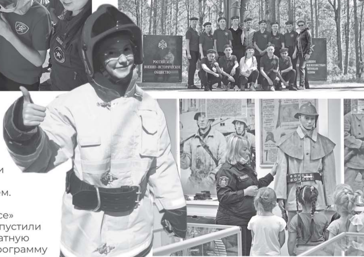
На снимках: моменты экскурсии «Я б в пожарные пошел»

Общение с огнеборцами и интерактив в пожарной части детям запомнятся лучше, чем лекции об осторожном обращении с огнем. Так решили в «Леноблпожспасе» и в начале лета запустили в Кировске бесплатную экскурсионную программу «Я б в пожарные пошел».