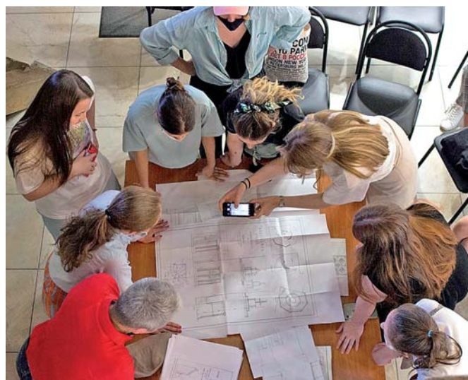
Студенты и преподаватели изучают музейную документацию в музее-крепости "Корела".