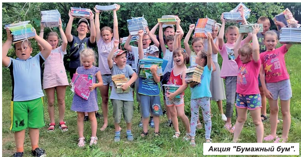
Акция "Бумажный бум".

На базе Коммунарской школы закончилась первая смена летних оздоровительных лагерей - ДОЛ "Непоседы" и ДОЛ "Юность" для детей, попавших в трудную жизненную ситуацию. 35 девочек и мальчишек отдохнули, загорели и подросли за этот месяц.