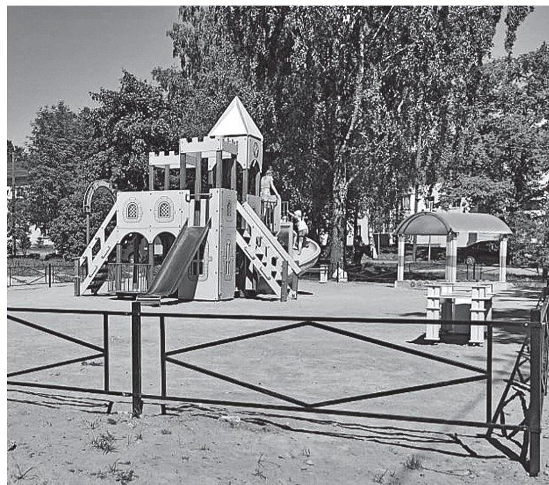
Детская площадка на улице Центральной возле дома № 13.

Также в деревне начато обустройство аллеи Победителей, которая находится на улице Центральной между домами № 10 и 13. Здесь ведутся работы по обустройству пешеходной дорожки и бордюра. В дальнейшем будут высажены хвойные деревья, кустарники и цветы, оборудовано уличное освещение и установлены малые архитектурные формы. Кроме того, аллею украсят памятник «В память о земляках, вставших на защиту Родины в годы Великой Отечественной войны, от благодарных потомков» и флаговая группа. Этот проект реализуется в рамках госпрограммы «Комплексное развитие сельских территорий Ленинградской области», ее подпрограммы «Развитие транспортной инфраструктуры и благоустройство сельских территорий». Стоимость строительных работ составляет около 2 милли-