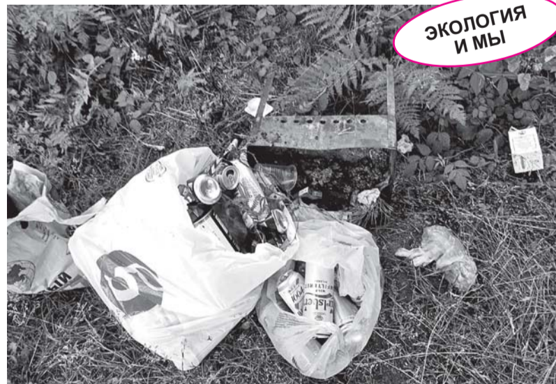
А вот что оставляют после себя отдыхающие.

песочницы, качели. На береговую линию завезен песок, установлены туалеты, засыпаны канавы и траншеи вдоль берега озера. Сделана парковка для мотоавтотранспорта, подведено электричество,