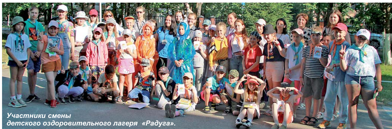
Участники смены детского оздоровительного лагеря «Радуга».