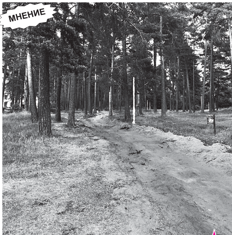
Главное условие - сохранение существующей пешеходно-тропиночной сети и растительности.

Жители выбрали проект, который соответствует классическому стилю, как и сам Культурный центр. Добавятся в таком же сдер-