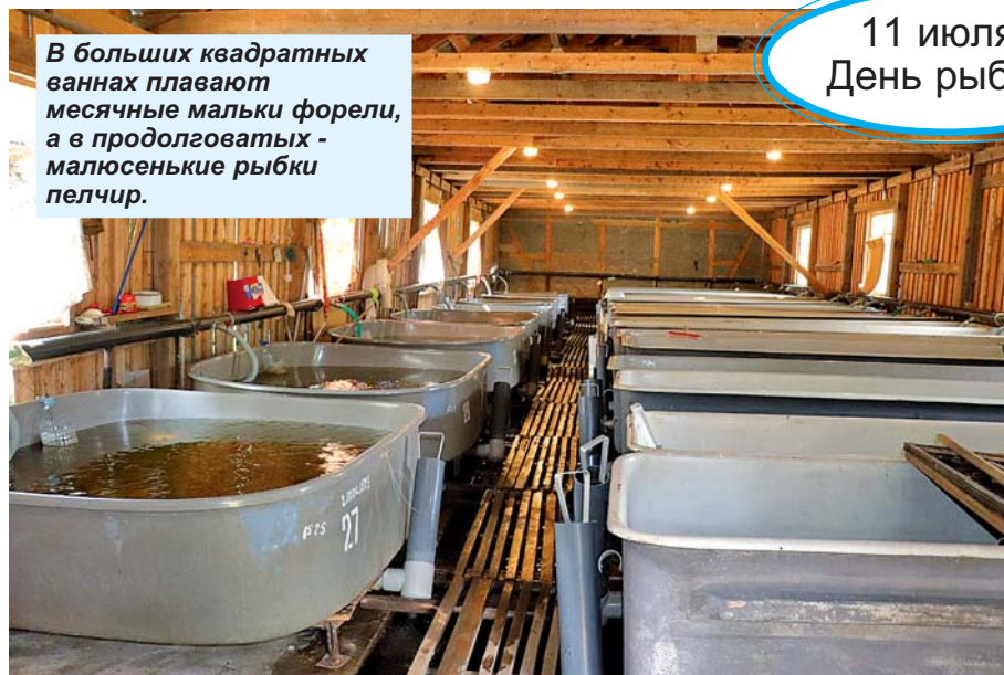
В больших квадратных ваннах плавают месячные мальки форели, а в продолговатых - малюсенькие рыбки пелчир.