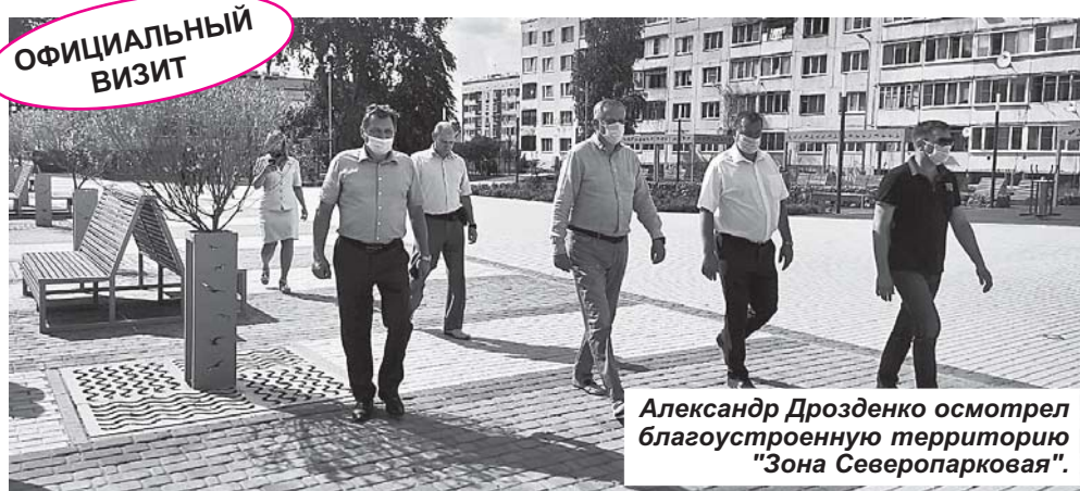
Александр Дрозденко осмотрел благоустроенную территорию "Зона Северопарковая".