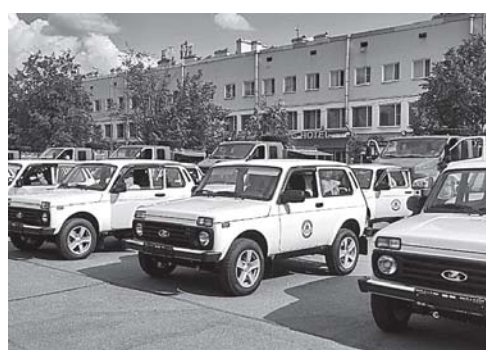
Лесопожарная техника - лесничествам филиалам ЛОГКУ "Леноблес".

медицинское учреждение возводят в рамках государственной программы "Комплексное развитие сельских территорий Ленинградской области".