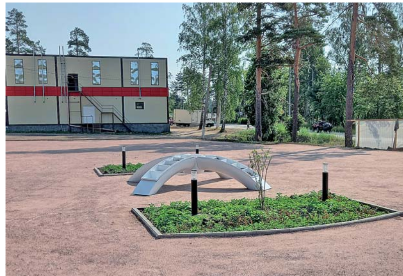
На месте заброшенного пустыря на ул. Первомайской обустраивается сквер.