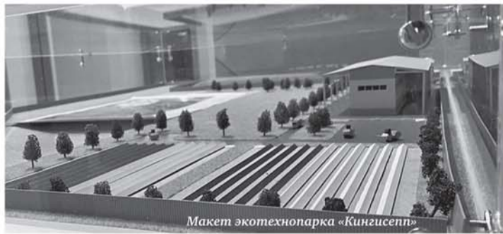
Макет экотехнопарка «Кинзисепп»

До конца года планируется начать строительство экотехнопарка в Кинзисеппе.