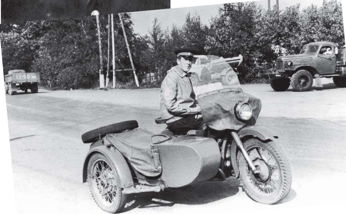
Начало службы в ГАИ. Фото конца 1960-х годов.