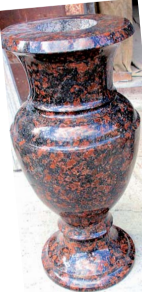
Изделия, изготовленные в семейной мастерской.

И в третьем помещении стоит компрессор («пескоструй»), который под давлением воздуха выбивает буквы. В остальном мас-