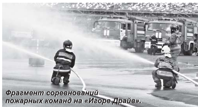
Фрагмент соревнований пожарных команд на «Игоре Драйв».

Команда 142-й пожарной части ОГПС Приозерского района успешно справилась с предложенными организаторами заданиями, личный