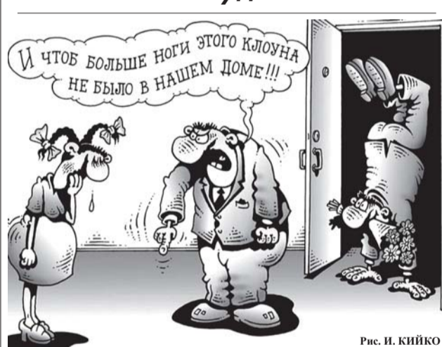
Рис. И. КИЙКО