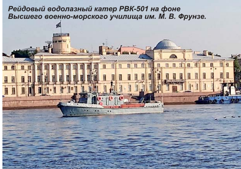
Рейдовый водолазный катер РВК-501 на фоне Высшего военно-морского училища им. М. В. Фрунзе.