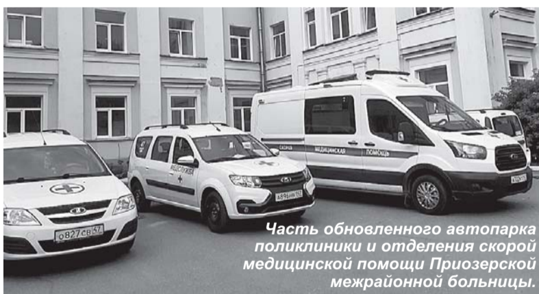
Часть обновленного автопарка поликлиники и отделения скорой медицинской помощи Приозерской межрайонной больницы.

- Часть из новых легковых машин была перераспределена в том числе и под оказание неотложной помощи, - пояснил Сергей Алексеевич. - В связи с вынужденным перегрузом отделения скорой медицинской помощи в больнице некоторые вызовы, в первую очередь по транспортировке пациентов с новой коронавирусной инфекцией на выполнение компьютерной томографии и часть до-