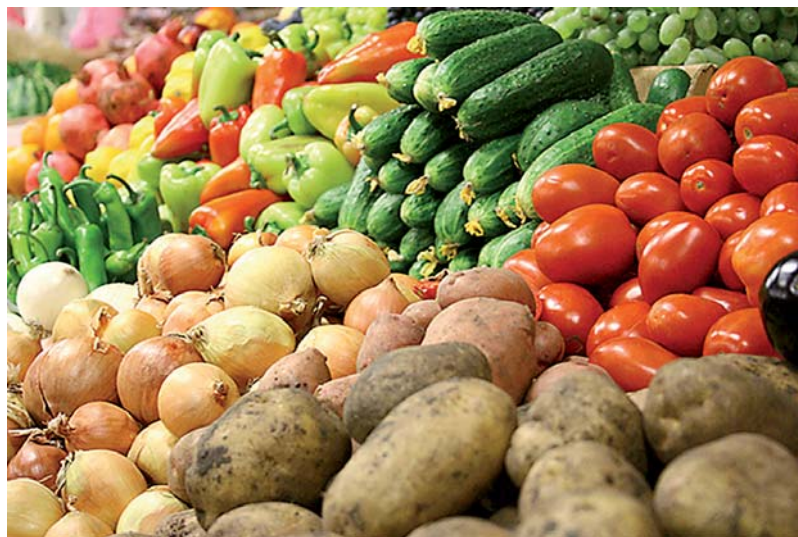
Фото с сайта uelbex.ru

Пресс-служба губернатора и правительства Ленинградской области