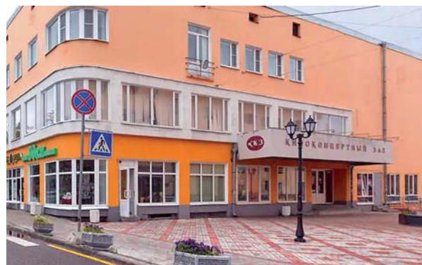
Общий вид здания ККЗ.

В 2019 году в рамках нацпроекта «Культура» для Приозерского ККЗ было приобретено звуковое оборудование нового поколения, отвечающее всем требованиям качества.