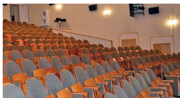
В зрительном зале.