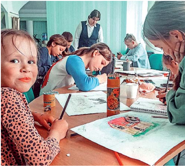
«Имажинисты» за работой.

И вот книга уже готова. Ее презентуют широкой публике завтра, 15 августа, в Приозерском ККЗ. Всех желающих