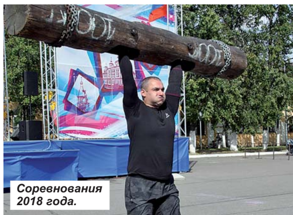
Соревнования 2018 года.