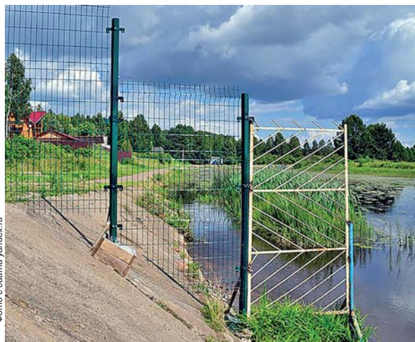
Фото с сайта yutdev.ru

Пресс-служба губернатора и правительства Ленинградской области