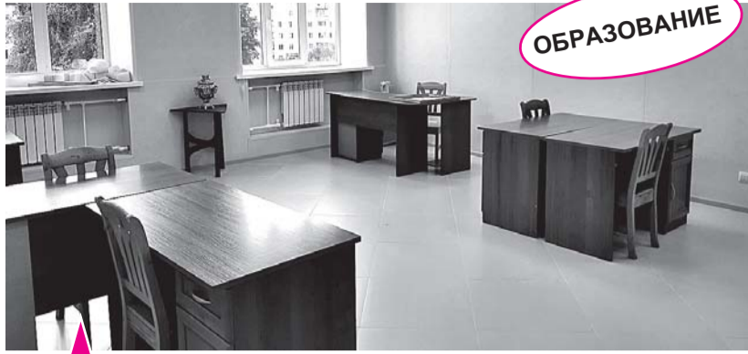
Электромонтажная мастерская и педагогический кабинет колледжа после ремонта.

В рамках подготовки к новому образовательному периоду в Приозерском политехническом колледже завершается ремонт учебного корпуса - электромонтажной мастерской на первом этаже и педагогического кабинета - на втором, отремонтированы семь помещений в студенческом общежитии.