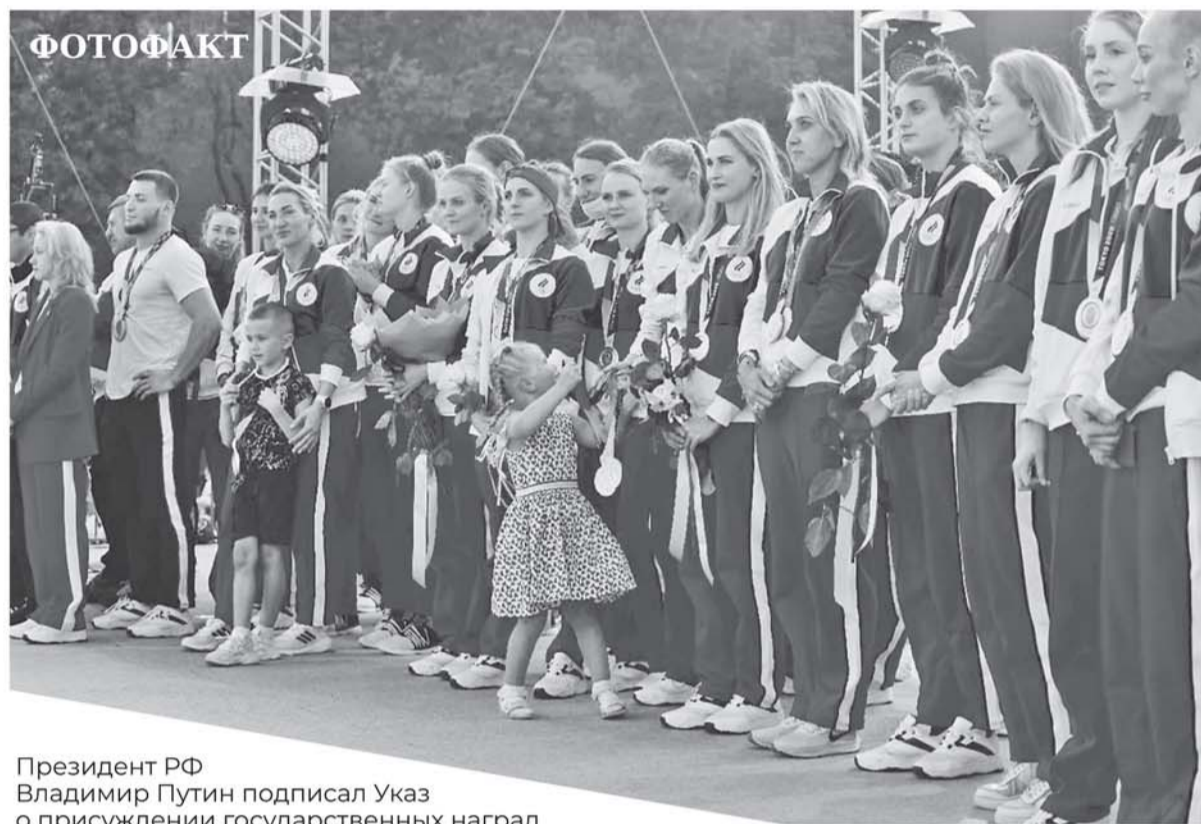
ФОТОФАКТ Президент РФ Владимир Путин подписал Указ о присуждении государственных наград победителям и призерам Олимпийских игр.

В рамках госпрограммы не только строят новые стадионы, ледовые арены, бассейны и комплексы, но и приводят в порядок существующие. За прошлый год капитальный ремонт завершили на семи спортивных объектах, включая Бокситогорский спортивный комплекс, Подпорожскую детско-юношескую спортивную школу, футбольные поля в Тихвине, Луге и Лодейном Поле.