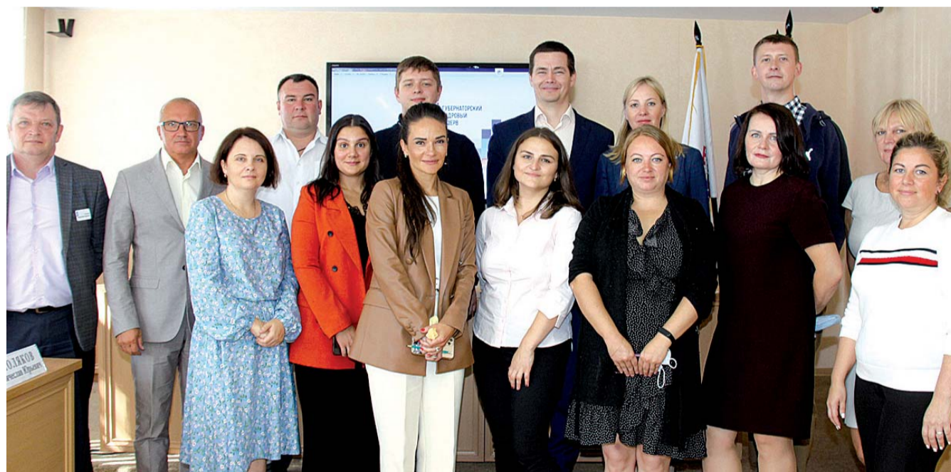
Участники и члены комиссии конкурса «Губернаторский кадровый резерв» перед началом заключительного муниципального этапа.

Не стоит отчаиваться и тем, кто в этот раз не вошел в число победителей. Кон-