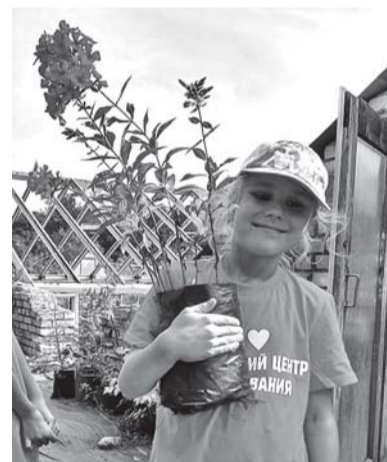
Ярко-розовый флокс в подарок девочкам.