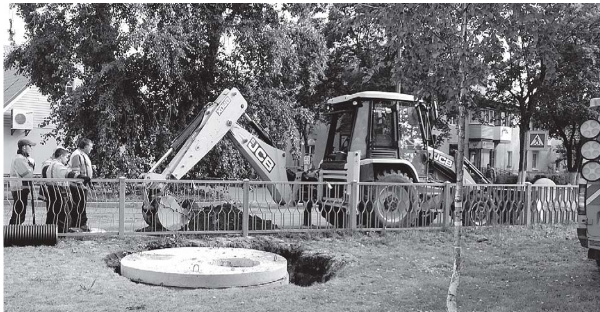
Недалеко от бывшего магазина «Чик» рабочие субподрядной организации ДРСУ установили два колодца: один на дороге, другой - рядом на газоне.

ные бассейны» уйдут в прошлое. Корреспондент «Красной звезды» сфотографировала, как недалеко от бывшего магазина «Чик»