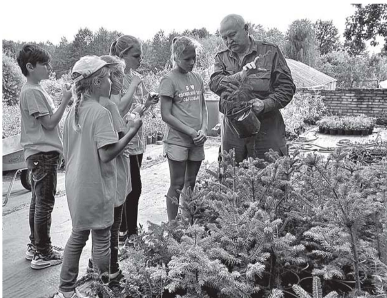
Воспитанники лагеря с удовольствием занимались посадкой деревьев.

Особое внимание девочек привлекли цветы, которые были яр-