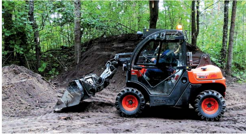
Проект «Комфортная среда»

С громких заявок начались в Приозерске работы по масштабному благоустройству двух дворовых территорий в рамках реализации мероприятий по программе «Формирование комфортной городской среды» - у дома № 15 по улице Гоголя и у дома № 16 по улице Гагарина. Сбор заявок от лиц, заинтересованных в благоустройстве дворовых территорий, проводился ещё в конце позапрошлого года, и все соответствовавшие требованиям положения заявки были отправлены в областной комитет по жилищно-коммунальному хозяйству. На благоустройство дворовых территорий на ул. Гагарина, 16, и Гоголя, 15, выделено около 16 миллионов рублей, и к 1 сентября должны быть завершены все работы.