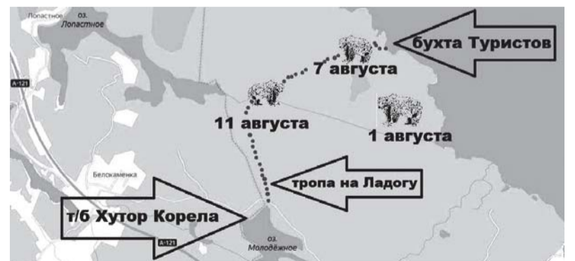
Графическое изображение места встречи туристки с медведем.