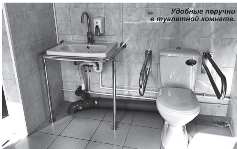
Удобные поручни в туалетной комнате.

лись подопечные местного дома сопровождаемого проживания. В этом доме живут семеро ребят - бывшие воспитанники психоневрологических интернатов, двое из которых на колясках, двое прак-