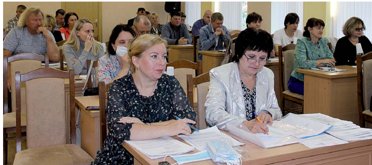
Совет депутатов за работой.

конодательного собрания Ленинградской области Светлана Потапова. В частности, она сказала, что работала в двух постоянных комиссиях Законодательного собрания - являлась председателем комиссии по агропромышленному и рыбохозяйственному комплексу. На 65 заседаниях комиссии рассмотрено более 600 вопросов. Среди них - программы «Развитие сельского хозяйства Ленинградской области» и «Комплексное развитие сельских территорий Ленинградской области», в задачи которых прежде всего входят комплекс мер поддержки сельского хозяйства и создание благоприятных условий проживания в сельской местности. Была также членом комиссии по бюджету и налогам. Ежегодно вносила поправки в проект закона о бюджете на очередной финансовый год.