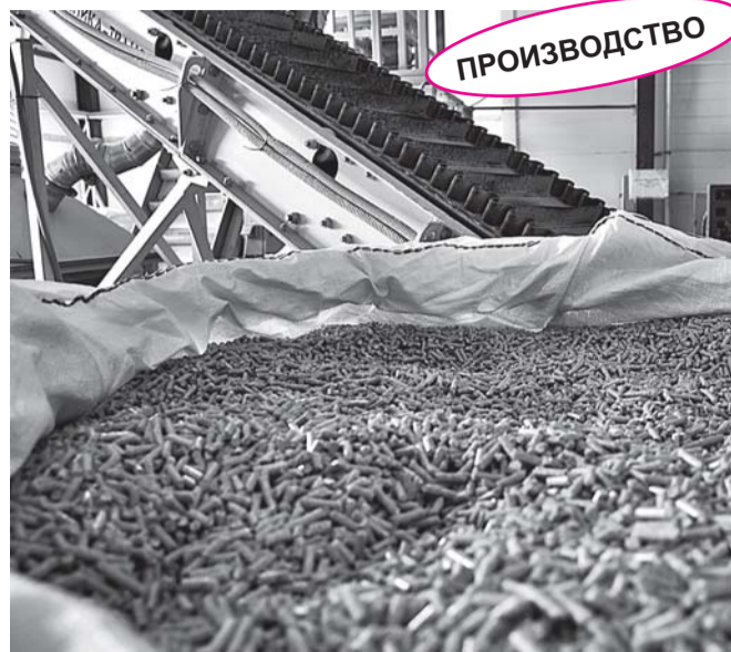
На территории сырьевого склада «Лесплитинвеста».