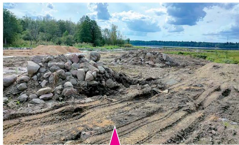
На берегу Правдинского озера кипит работа.

не местных водоемов уже поступила реакция - из Приозерской городской прокуратуры.