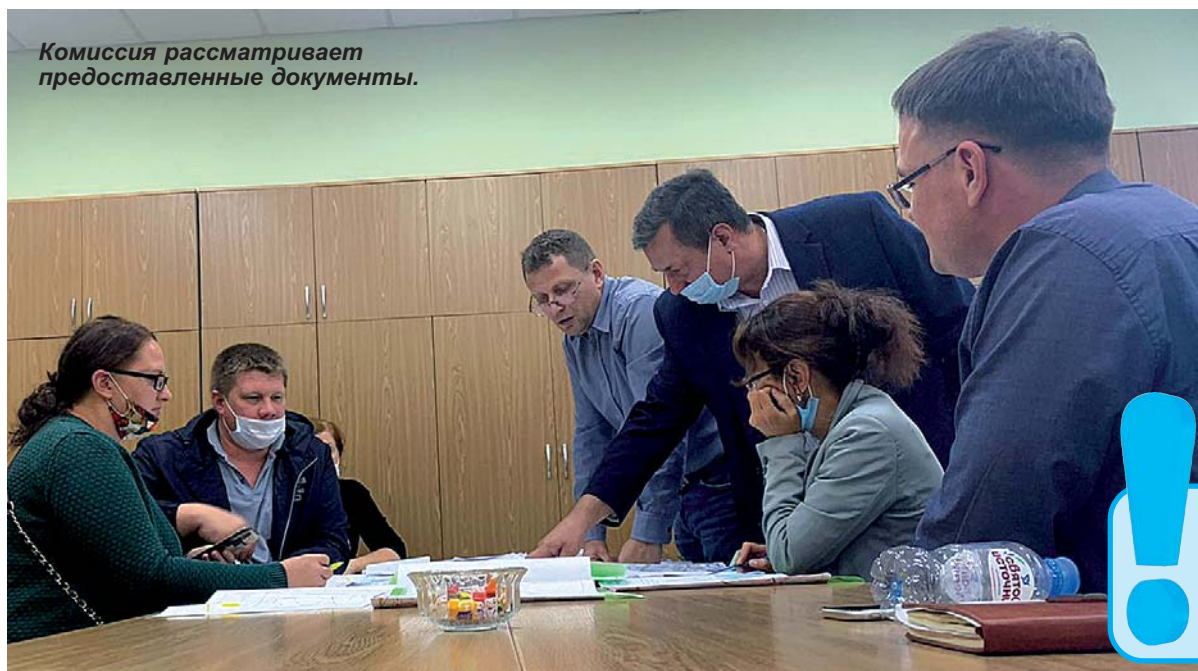
Комиссия рассматривает предоставленные документы.

члены комиссии, тоже порадовались за них», - поделился глава приозерской районной админист-