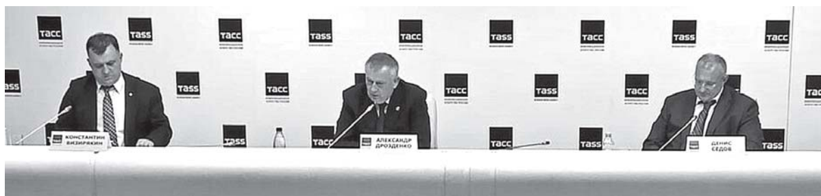
Слева направо - Константин Визирякин, Александр Дрозденко, Денис Седов.

17 августа состоялось очередное заседание губернаторского пресс-клуба. В нем приняли участие губернатор региона Александр Дрозденко и председатель дорожного комитета области Денис Седов, вел заседание председатель комитета по печати области Константин Визирякин. Темой для обсуждения было состояние автомобильных дорог в регионе.