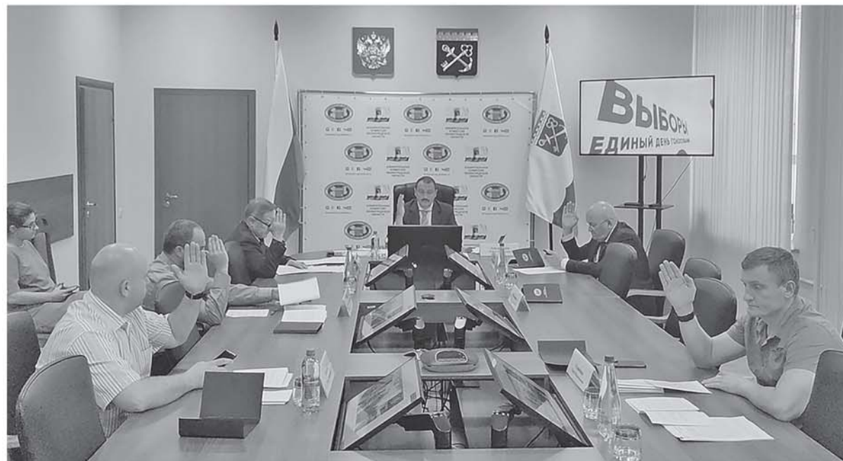
На заседании Леноблизбиркома

Проголосовать на дому можно по уважительным причинам, таким как состояние здоровья, инвалидность и т. д. Для этого нужно подать заявление в участковую избирательную комиссию с 9 сентября до 14 часов 19 сентября. Сделать это можно письменно, по телефону, через других лиц или через портал «Госуслуги».