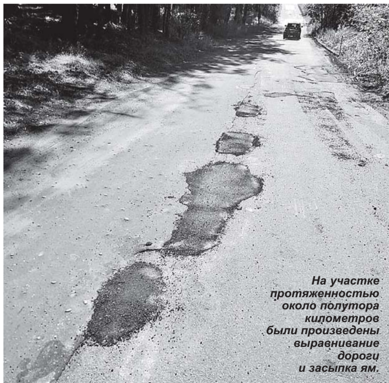
На участке протяженностью около полутора километров были произведены выравнивание дороги и засыпка ям.

Видеокomentarий заместителя городского прокурора младшего советника юстиции Г. Мениса смотрите на сайте «Красной звезды».