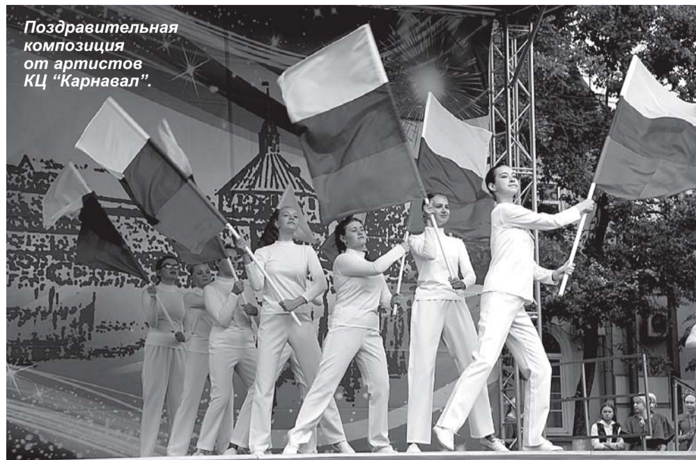
Поздравительная композиция от артистов КЦ "Карнавал".

«Сегодня мы как никогда понимаем, насколько важно сохранять гражданский мир и согласие между народами, понимаем, что начинать воспитывать уважение к го-