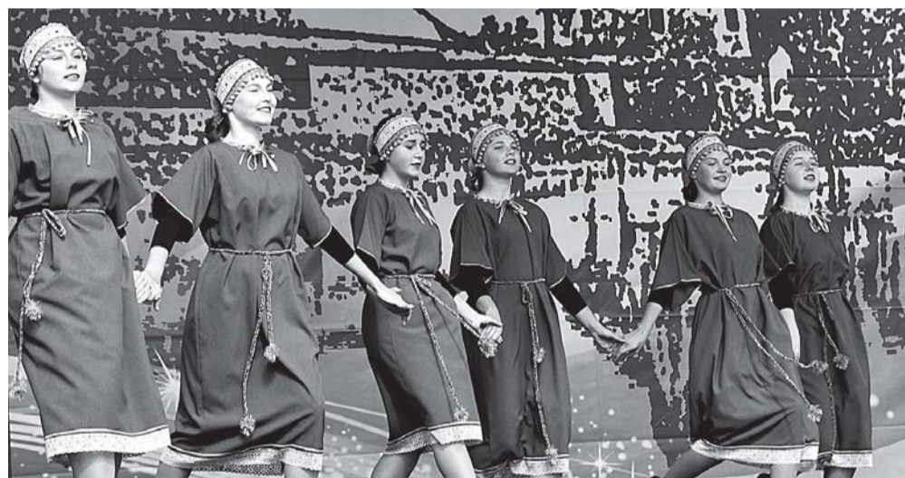
Танец "Девичий хоровод" (хореографический коллектив "Поколение").

сударственным символам нужно с юных лет, что каждый на своем месте должен стремиться достойно служить России. Под российским флагом с гордостью не раз стояли наши приозерцы - спортсмены, наша молодежь - слава и надежда При-