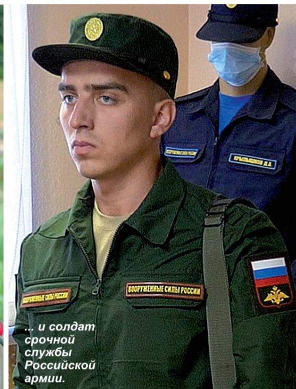
... и солдат срочной службы Российской армии.

хочет от жизни, отслужит в армии, то без куска хлеба он не останется. В этой службе в течение года самое главное - освоить азы. Базис должен быть всегда.