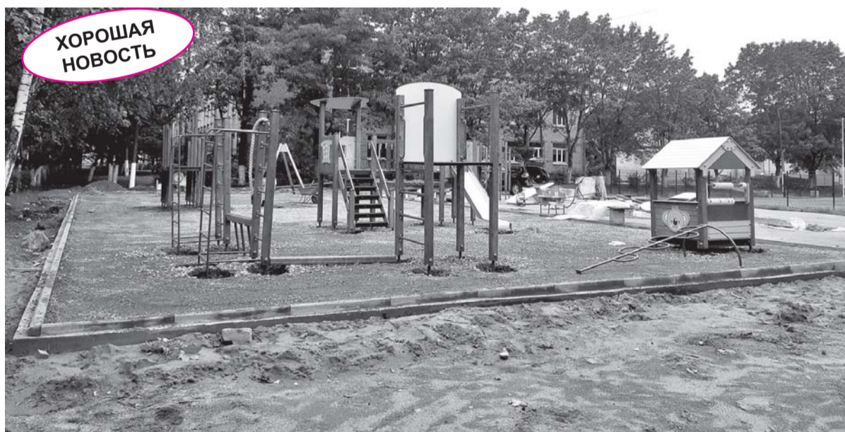
Оборудование нового детского спортивного комплекса СОШ № 5 на этапе установки.