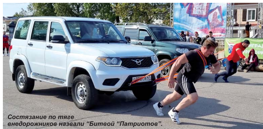
Состязание по тяге внедорожников назвали «Битвой «Патриотов».