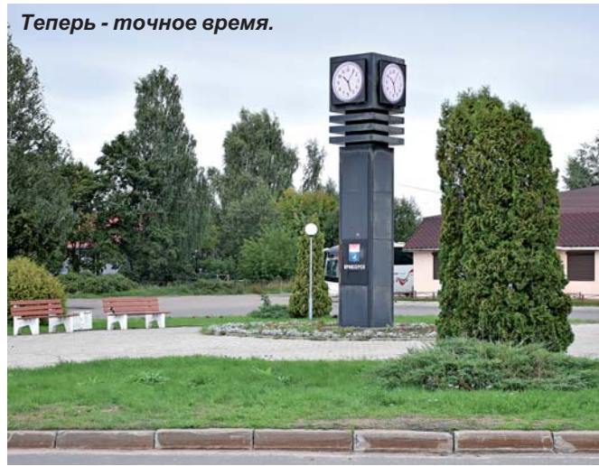
Теперь - точное время.