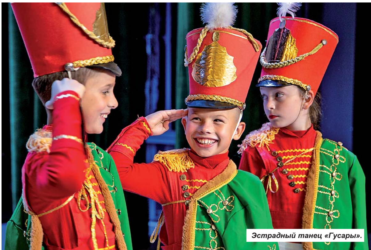
Эстрадный танец «Гусары».