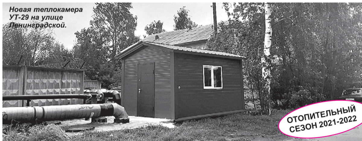
Новая теплокамера УТ-29 на улице Ленинградской.