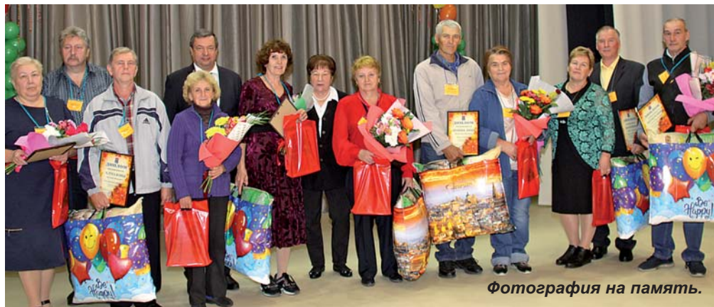
Фотография на память.

27 августа в Приозерске чествовали победителей и участников районного смотра-конкурса «Ветеранское подворье-2021». Подведение итогов, вылившееся в большой красивый праздник, состоялось в обновленном КЦ «Карнавал».