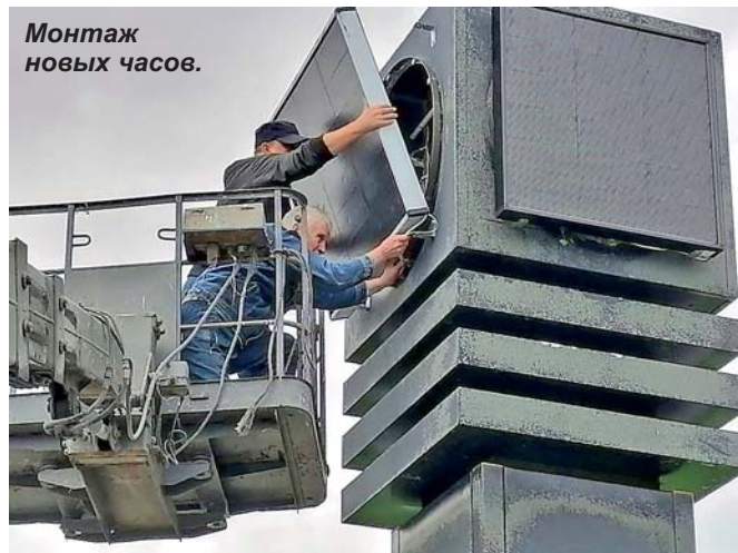
Монтаж новых часов.