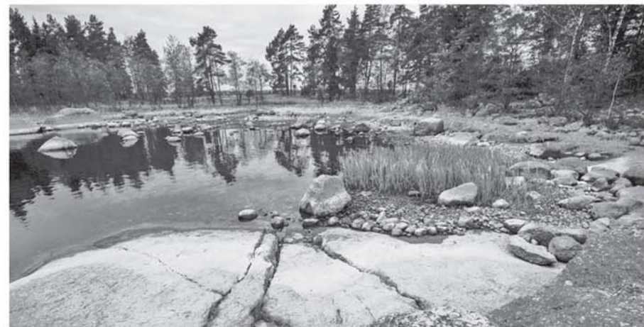
Государственный природный заказник «Кивипарк»

Всего на конкурс, организованный Агентством стратегических инициатив, было подано 192 туристических маршрута, охвативших 60 субъектов РФ и восемь федеральных округов — от Калининграда до Сахалина. В финал прошли только 33 маршрута, а это значит, что проекты Ленинградской области стали одними из лучших.