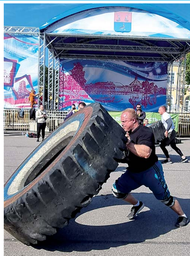
Покрывка от БелАЗа весит 500 кг. Перевернуть машину на скорость нужно было три раза.