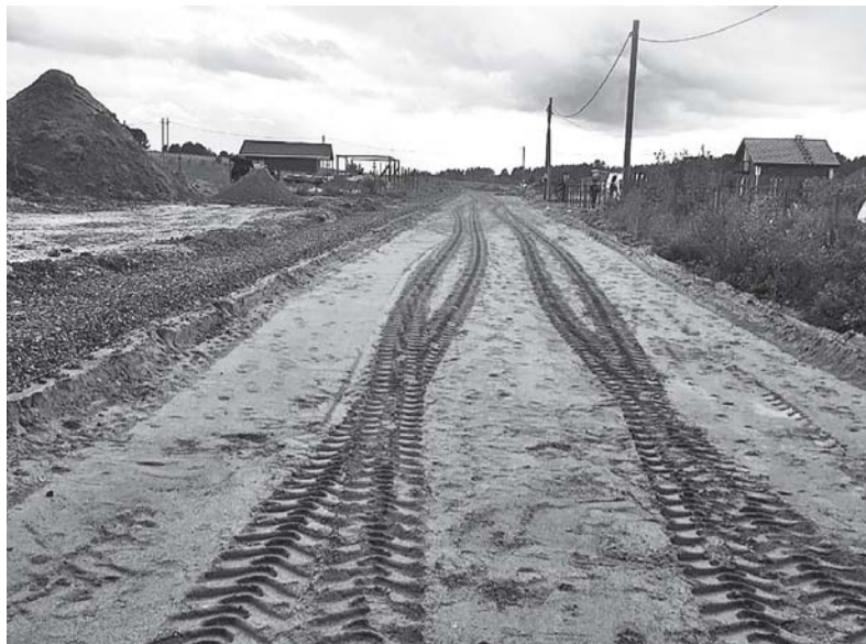
В пос. Денисово ведется строительство подъездных дорог в жилмассиве в рамках областного закона № 105-оз.

Вторая наша большая стройка - благоустройство общественной территории «Парковая зона у реки Вьюн» (1 этап) в рамках муницип-