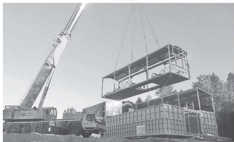
Реконструкция канализационных очистных сооружений в дер. Старая Слобода (Лодейнопольский район)