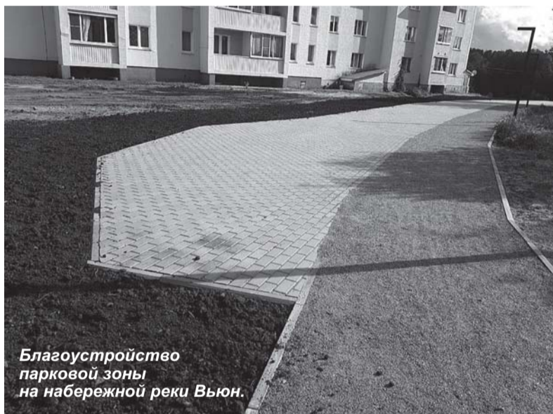
Благоустройство парковой зоны на набережной реки Вьюн.

пальной программы «Формирование комфортной городской среды». Цена контракта составляет более 7 миллионов рублей. Многие на берегу реки уже сделано: спланирована территория по зонам отдыха, построены набивные дорожки, установлены бортовые камни, произведено освещение общественной зоны, заказаны пергола и стелы для фотозоны, ведутся работы по подготовке почвы для устройства газона.