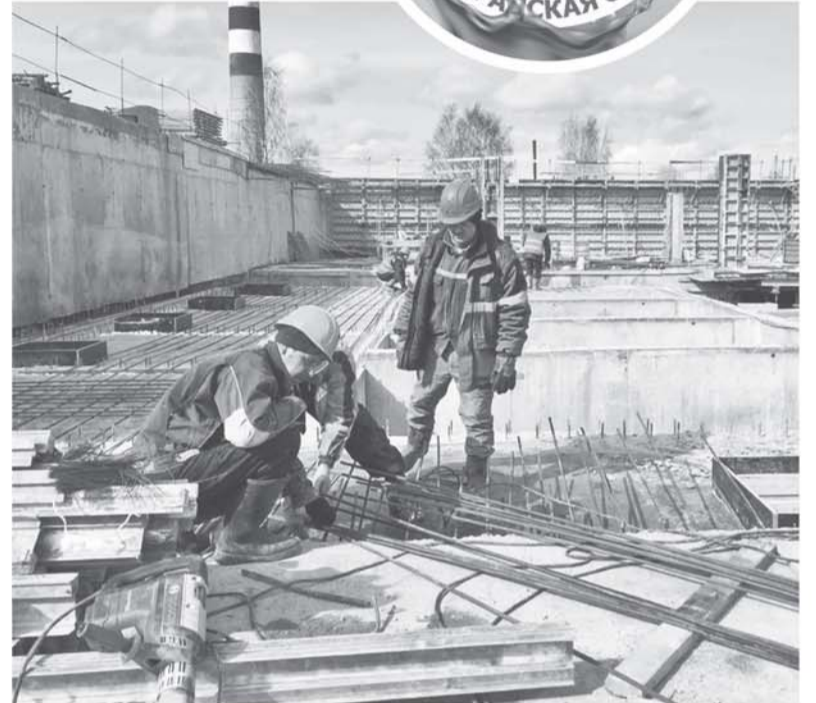
Реконструкция канализационных очистных сооружений в Подпоржье