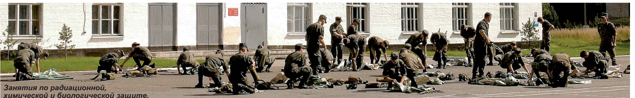
Занятия по радиационной, химической и биологической защите.