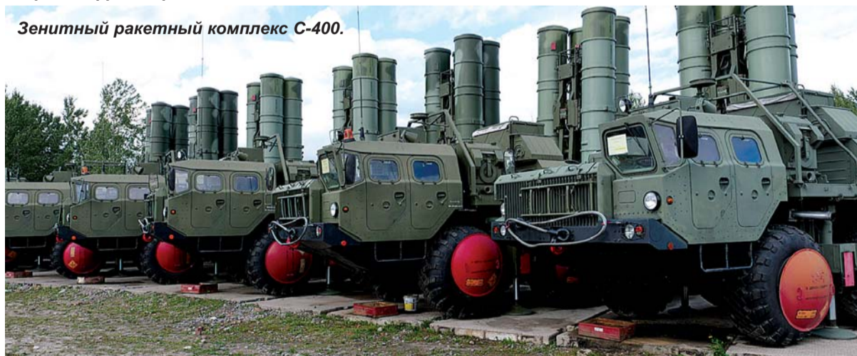
Зенитный ракетный комплекс С-400.