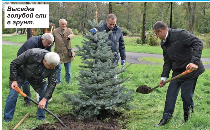
Высадка голубой ели в грунт.

Татьяна ВАЙНИК Фото предоставлены автором