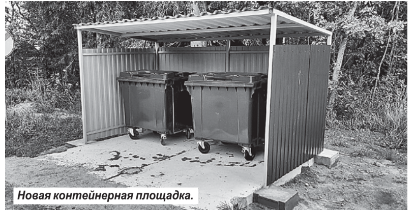
Новая контейнерная площадка.