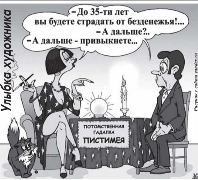
Улыбка художника Рисуют с сайта uanifesty

Решением Верховного суда РФ владельцам садовых участков в России запрещено разводить на них сельскохозяйственных, включая кур. Земельный кодекс не допускает нецелевое использование территории. Садовый участок, согласно нормативно-правовым актам, предназначен для отдыха и выращивания сельхозкультур для собственных нужд, а разводить там скот можно только в случае, если участок является личным подсобным хозяйством.