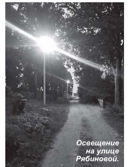
Освещение на улице Рябиновой.

Работы по благоустройству в Плодовском сельском поселении продолжились установкой новых контейнерных площадок. По государственной программе Ленин-