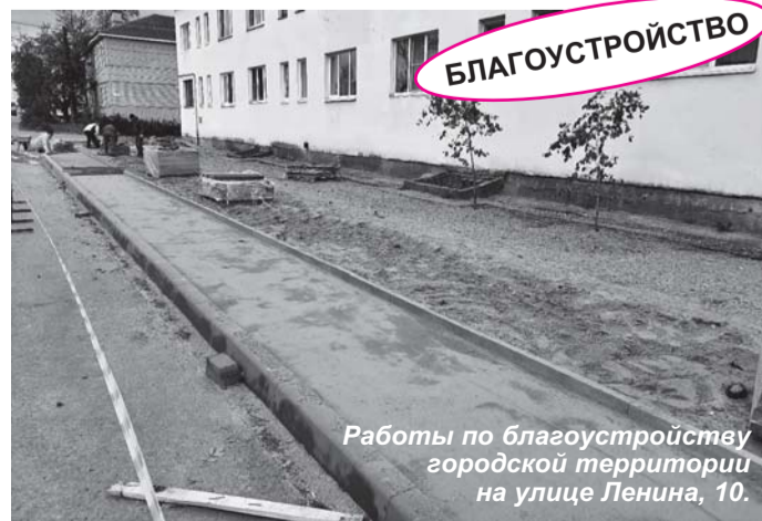
Работы по благоустройству городской территории на улице Ленина, 10.