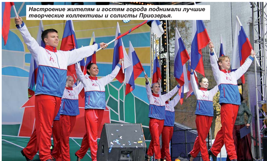
Настроение жителям и гостям города поднимали лучшие творческие коллективы и солисты Приозерья.