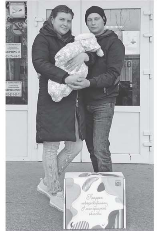
В подарочный набор входят пеленки, распашонки, чепчики