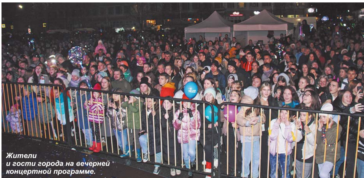
Жители и гости города на вечерней концертной программе.