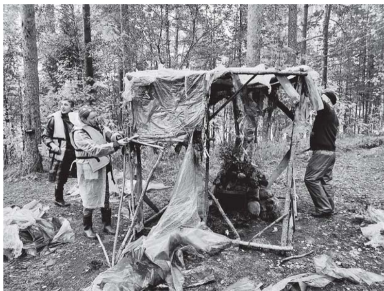
«Акцент мы делали на разборе пленочных псевдобань, построенных туристами на берегах».