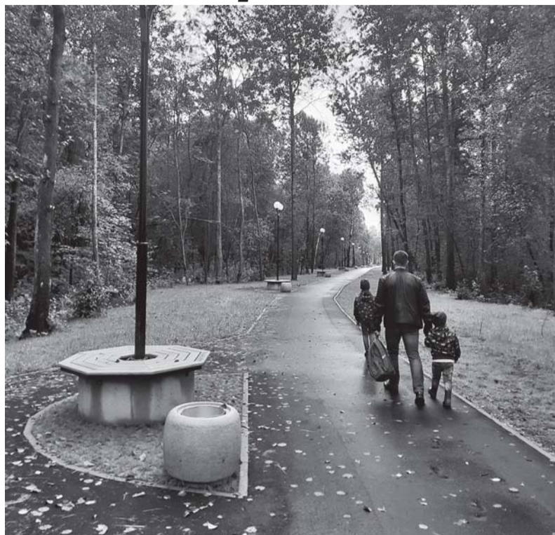
Из-за отсутствия удобств прогулка по красивой приозерской набережной не всегда бывает комфортной...