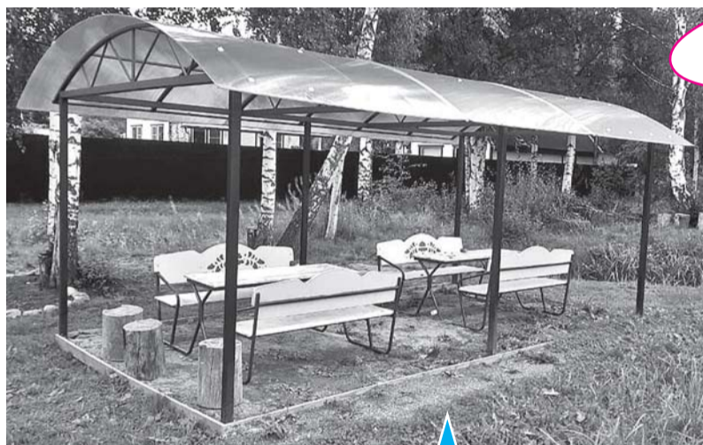
Детская площадка, обустроенная жителями посёлка Шумилово.