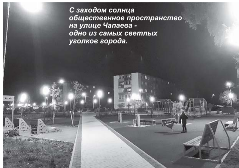
С заходом солнца общественное пространство на улице Чапаева - одно из самых светлых уголков города.