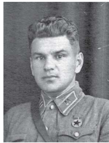
Николай Дроздов в 1939 году.