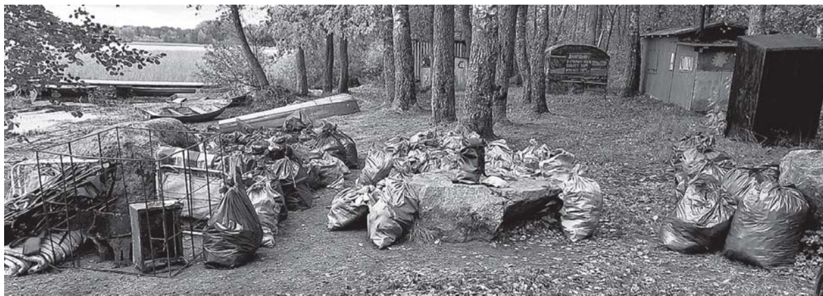
Всего собрали более 130 мешков, не считая огромного количества сломанных стульев, матрасов, мангалов и прочего «крупногабарита».