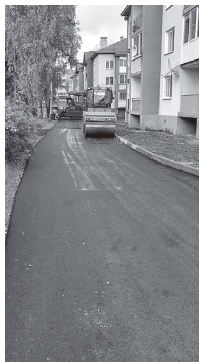
Ремонт Типографского переулка в пос. Сосново.

Заменено асфальтовое покрытие на участке улицы Строителей возле дома № 13, а также на участке вдоль Типографского переулка, общая протяженность обновленной дороги - 300 метров. Деньги были выделены благодаря участию администрации Сосновского поселения в программе областного комитета по дорожному хозяйству «Развитие сети автомобильных дорог общего пользования». Общая стоимость проекта - 3 млн 300 тыс. рублей. Также сделан ремонт участка грунтовой дороги протяженностью 200 метров на улице Пионерской, здесь произведена отсыпка щебнем с последующим выравниванием щебеночно-песочной смесью. На строительные работы было потрачено около 1 млн рублей. Кроме того,