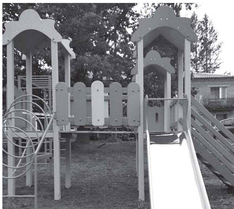
Новая детская площадка в деревне Кривко.

была произведена установка «лежачих полицейских» у детского сада и на улице Механизаторов возле дома № 11-а. Данное мероприятие профинансировано из бюджета поселения, стоимость установки составила 60 тыс. рублей.