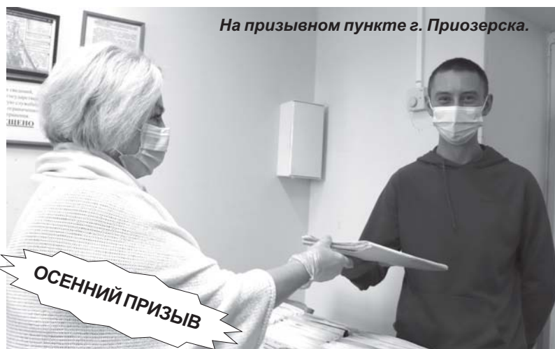
На призывном пункте г. Приозерска.

На призывном пункте г. Приозерска 5 октября собралось много ребят разного возраста - от 18 до 26 лет. Соблюдая положенную дистанцию в коридорах, все стояли в медицинских масках и негромко переговаривались в ожидании приема врачей.