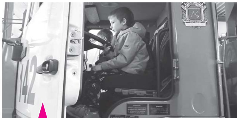
Экскурсанты в кабине пожарной машины.