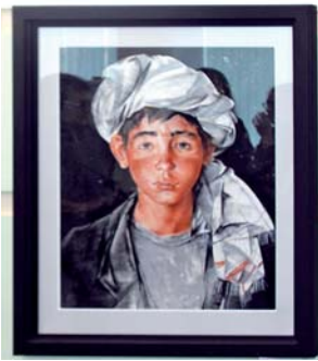
"Портрет мальчика". Бумага, темпера, пастель. 2017 г.