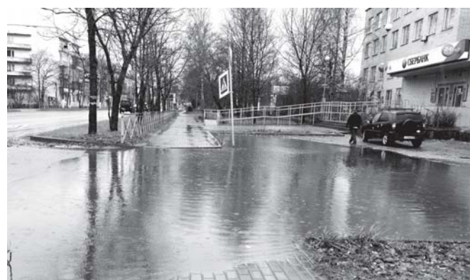
Огромная лужа на стоянке у банковского здания на улице Красноармейской, 10.

Ровно год назад в газете «Красная звезда» был опубликован материал «К ямам у «Сбера» пора принять меры». И вот в очередной раз журналисты поднимают вопрос об огромной луже, которая разливается на стоянке у банковского здания на улице Красноармейской, 10.