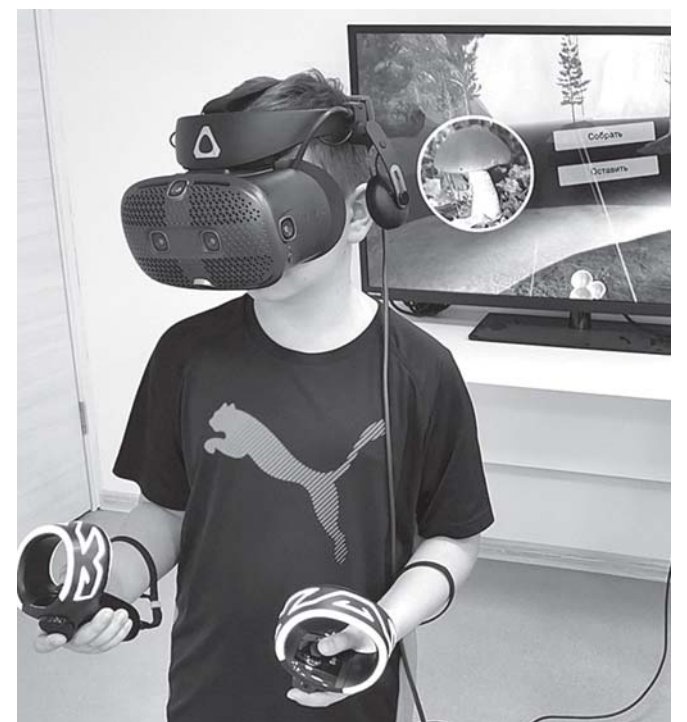
Отработка практических навыков, способных увеличить шансы на спасение и умение оказать помощь окружающим, с помощью виртуального тренажера.

Татьяна ВАЙНИК Фото предоставлены автором