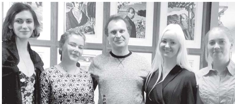
Выставка печатной графики