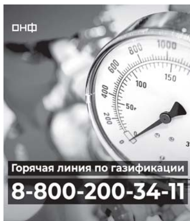
Горячая линия по газификации 8-800-200-34-11

На «горячую линию» граждане могут обратиться и получить исчерпывающие ответы на вопросы, которые возникают из-за проблем, связанных с газификацией в их населенных пунктах, на конкретных участках и придомовых территориях. Несмотря на то что Минэнерго очень подробно информирует граждан о текущих условиях газификации, вопросы все равно остаются и мы готовы на них ответить», - отметил заместитель ру-