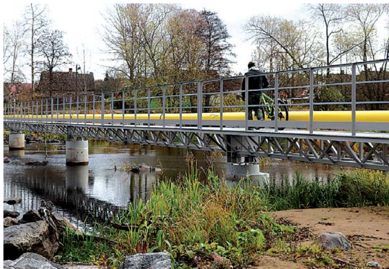
Во время проведения работ по комплексному ремонту «чертика» через Вуоксу можно спокойно перейти по стоящему рядом мосту, возведенному вдоль трубопровода.