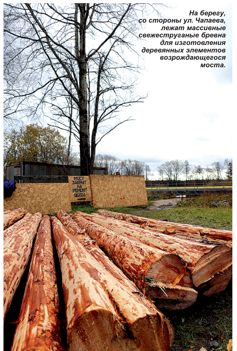
На берегу, со стороны ул. Чапаева, лежат массивные свежеструганные бревна для изготовления деревянных элементов возрождающегося моста.