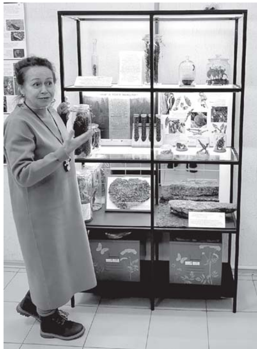
Одна из инсталляций выставки «Природа Вуоксы - от Саймы до Ладоги».

Делегация Евросоюза посетила выставку в Доме культуры «Природа Вуоксы - от Саймы до Ладоги», созданную Балтийским фондом природы в ходе российско-финского проекта RiverGo.