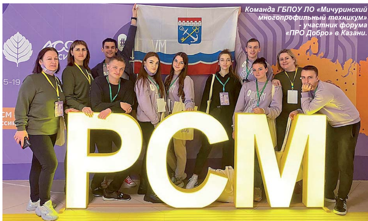
Всероссийский форум «ПРО Добро»

«Форум воодушевил нас. Мы вернулись с мощными идеями, желанием работать и двигаться дальше! «ПРО Добро» - это развитие патриотического воспитания и добровольчества. Одной из причин нашего участия в форуме послужило