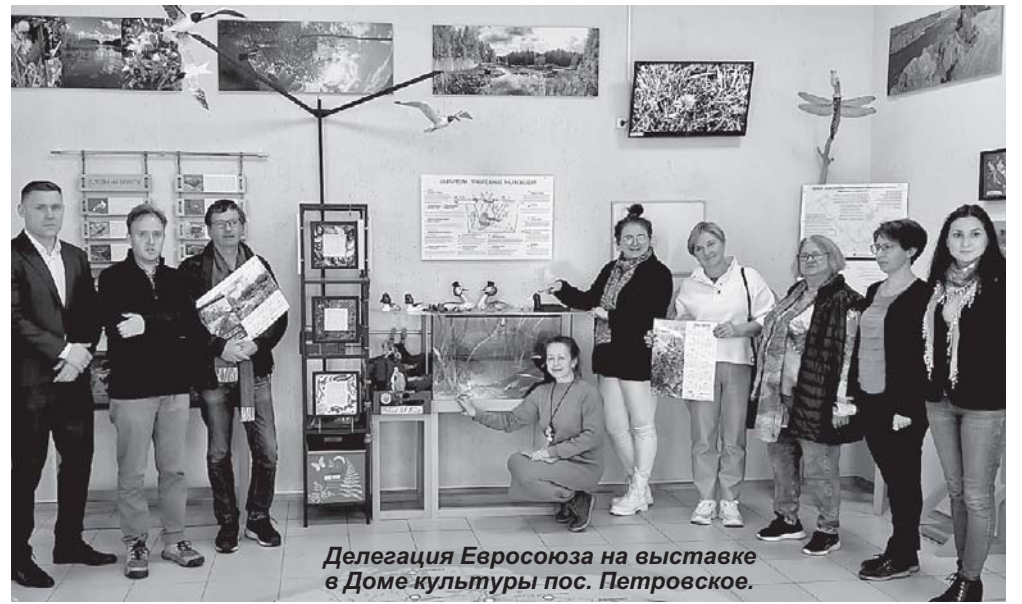
Делегация Евросоюза на выставке в Доме культуры пос. Петровское.

Благодаря команде специалистов Балтийского фонда природы выставка интересна не только взрослым, но и детям. Ее двенадцать тематических инсталляций рассказывают о растительном и живот-