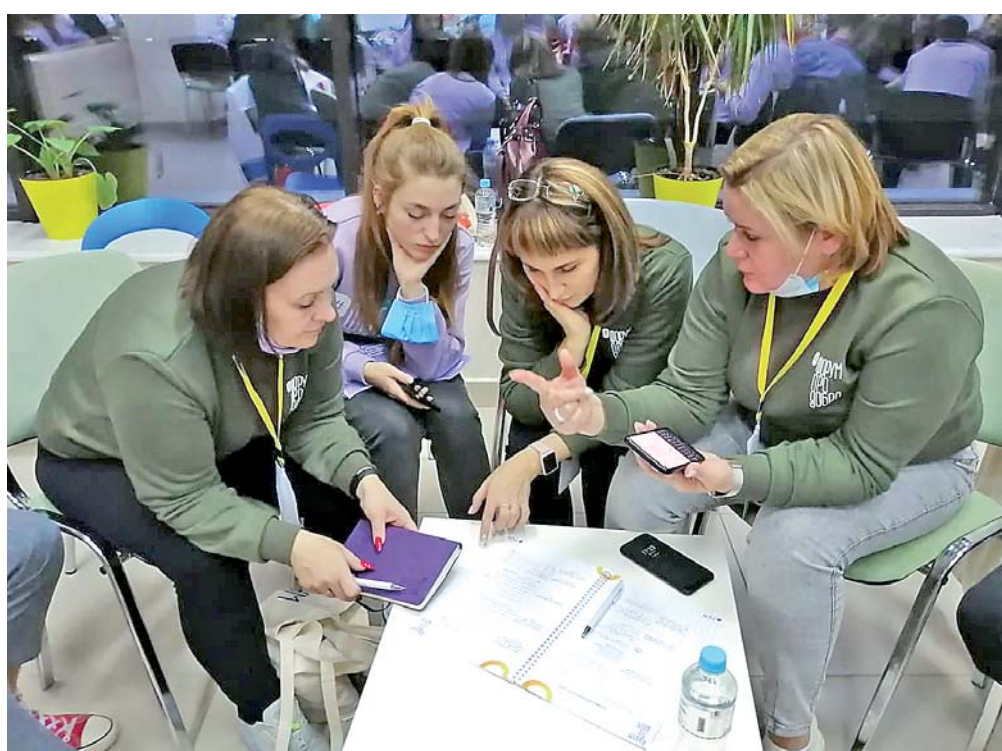
День третий, работа кипит.