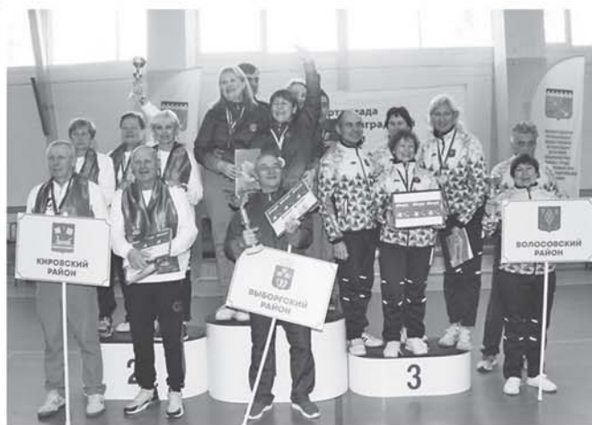
Пьедестал почета Третьей спартакиады ветеранов Ленобласти