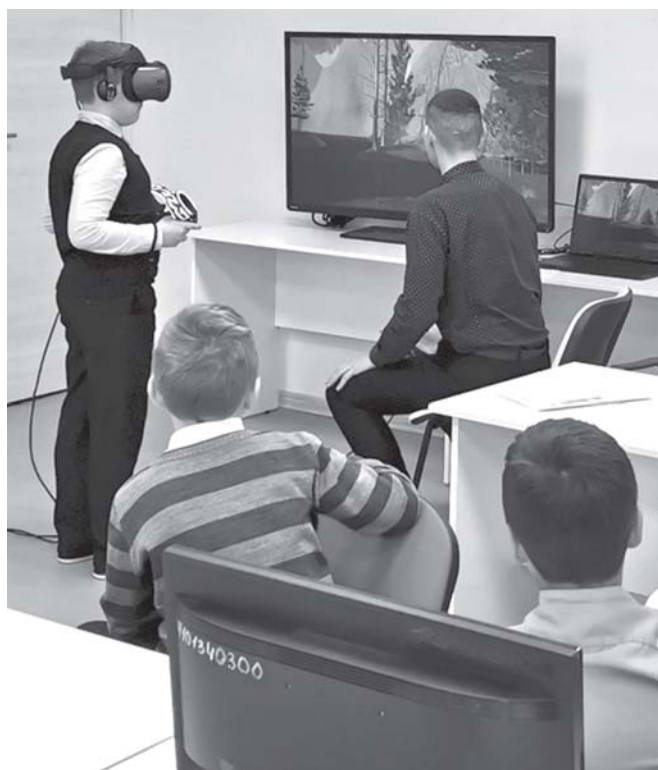
Знакомство четвероклассников школы № 1 с “VR-ОБЖ” - тренажером виртуальной реальности.

Говорящие роботы, шлемы виртуальной реальности, 3D-принтеры и многое другое, что еще недавно воспринималось как фантастика, теперь становится привычным не только в продвинутых гимназиях, но и в школах малых городов и сел. Классы, где ученики могут осваивать передовые технологии и развивать свои таланты, назвали «Точки роста». Они созданы в рамках национального проекта «Образование».