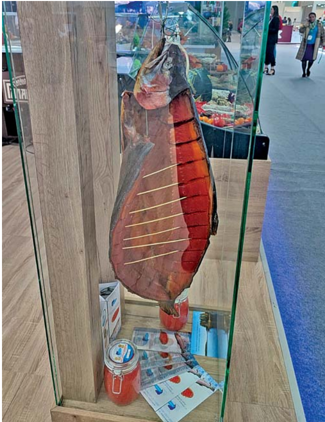
Все, кто посетил выставку, были в восхищении именно от приозерской рыбной продукции.

ряд в поселке Петровское на базу туристско-спортивного комплекса «Связист» приезжают спортивные команды из представителей старшего поколения ленинградцев и пробуют свои силы в различных видах спорта. В этом году в состав команды Приозерского района