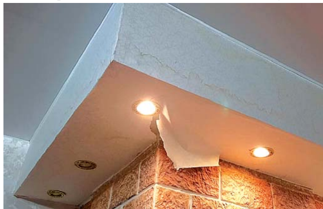
Подвесные потолки и обои на стенах в квартире на последнем этаже требуют восстановления.