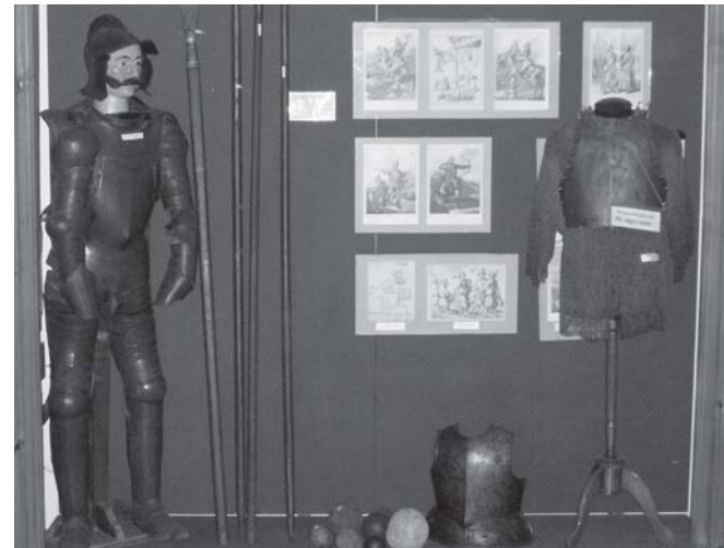
ПОРТРЕТ ПЯТНАДЦАТЫЙ - ПЛАСТИНЧАТЫЙ ДОСПЕХ

К слову сказать, если вы откроете интернет и захотите узнать об украшениях древних карел, то увидите почти полностью процитированную именно эту книгу. Статьи будут под разными названиями, созданными разными людьми, но содержание будет то же самое, что и в монографии Кочкуркиной.