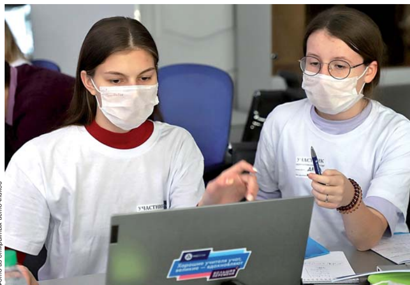
Фото из открытого источника

Пресс-служба администрации МО Приозерский муниципальный район