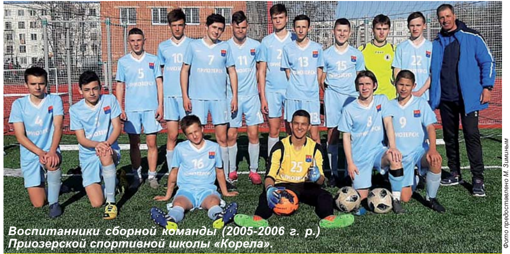
Воспитанники сборной команды (2005-2006 г. р.) Приозерской спортивной школы «Корела».