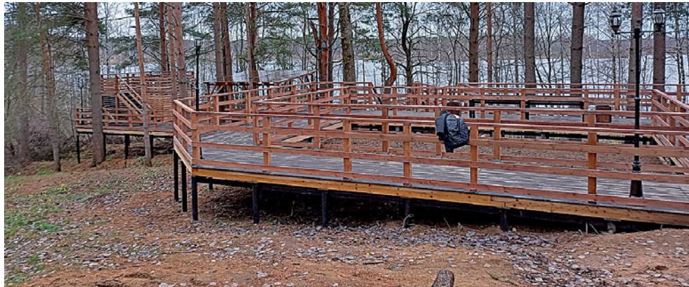
Красиво смотрятся площадки для отдыха, расположенные у озера Вольтинское.

по запатентованной отечественной технологии позволяют снизить затраты на отопление расчетно примерно на 80 процентов. Стоимость оборудования и работ в муниципальной бане составила 3,2 млн рублей, большая часть из которых - областная субсидия. Она была выделена в рамках подпрограммы «Энергосбережение и повышение энергетической эффективности на территории Ленинградской области» государственной программы «Обеспечение устойчивого функционирования и развития коммунальной и инженерной ин-