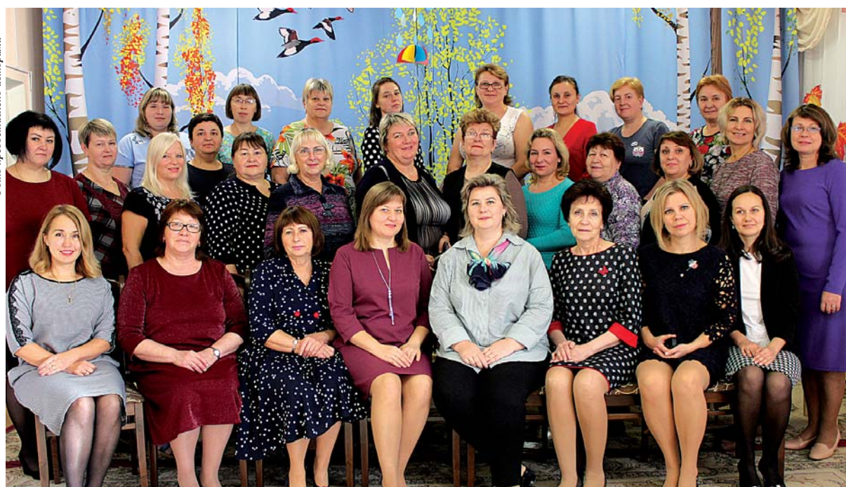
Сотрудники детского сада № 9 «Ягодка».

дителем конкурса среди муниципальных образовательных учреждений на кубок главы администрации МО Приозерский муниципальный район в номинации «Лучшее муниципальное дошкольное образовательное учреждение», и в этом году вновь наше учреждение стало «Лучшим муниципальным дошкольным учреждением». Много достигнуто, но впереди большие перспективы и планы, новые идеи и замыслы.