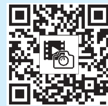
Видеосюжет и больше фото смотрите на сайте "Красной звезды".