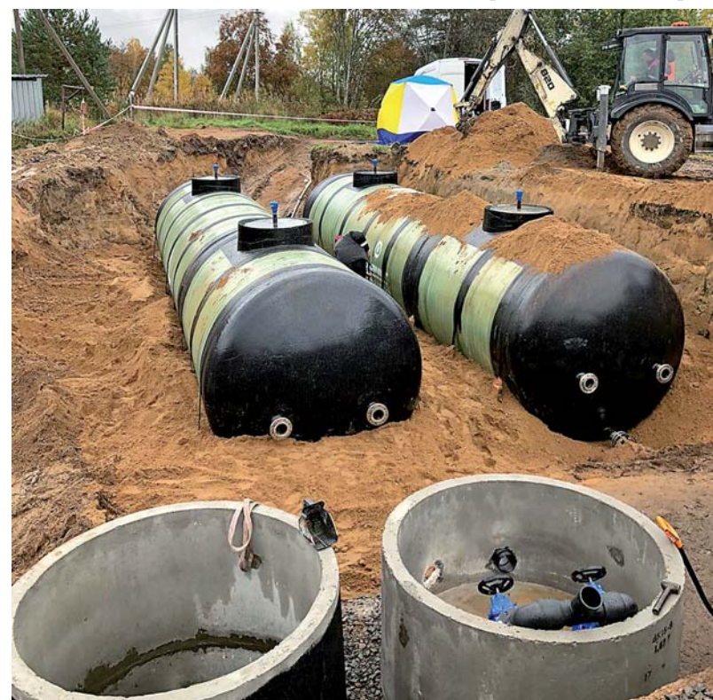
Монтаж резервуаров для чистой воды в п. Денисово.