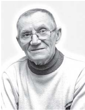
Родные и близкие

Камнеобрабатывающий цех г. Приозерска ПАМЯТНИКИ из гранита МЕТАЛЛИЧЕСКИЕ ОГРАДКИ Гравировка. Установка. Пенсионерам, инвалидам - дополнительные скидки. Рассрочка платежей без %. Бесплатное хранение. Предоставление справок по линии военкомата. Ул. Пушкина, 19-а, тел. 35-647, 8-962-702-67-89.