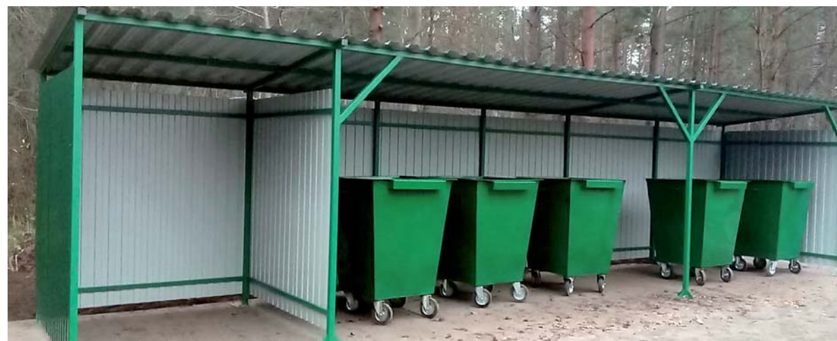
Новая мусорная площадка на ул. ГЛОХ в п. Запорожское.