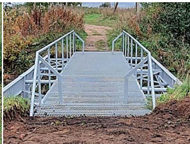
Мост в п. Луговое - было (слева) и стало (справа).