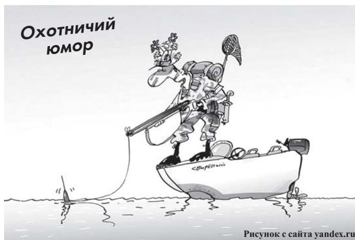
Рисунок с сайта yandex.ru