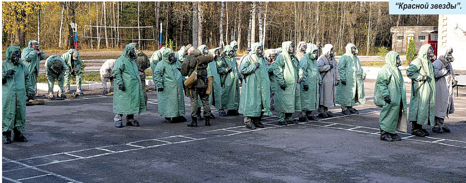
Тренировка в выполнении нормативов по РХБЗ.