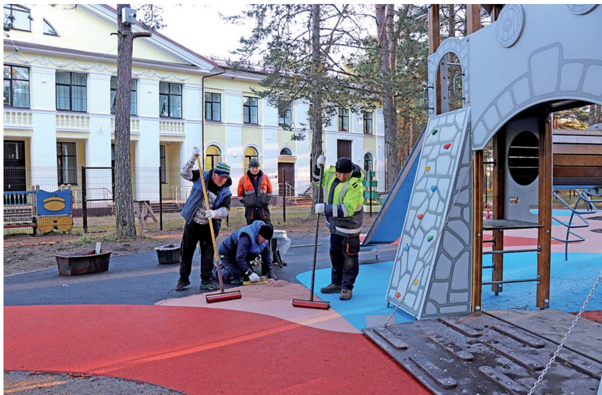
Укладка разноцветного покрытия на основе резиновой крошки.