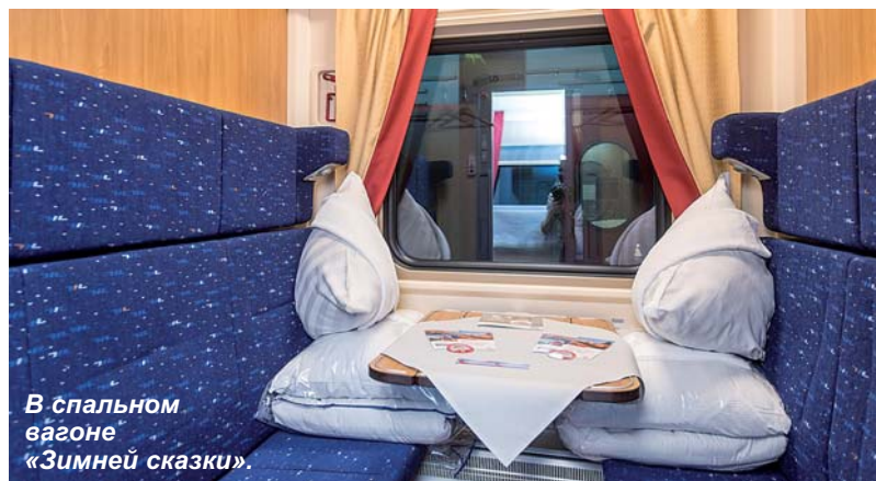
В спальном вагоне «Зимней сказки».

12 ноября с Ладожского вокзала Санкт-Петербурга в первую поездку отправился туристический круговой поезд № 924/923 «Зимняя сказка». Он будет курсировать по маршруту Санкт-Петербург - Великий Устюг - Вологда по пятницам 19 и 26 ноября, а также 3, 10, 17 и 24 декабря.