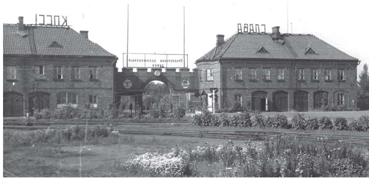
Здания заводоуправления Приозерского целлюлозного завода. Фото 1950 года.

новых очистных сооружений, это не возымело никакого эффекта.