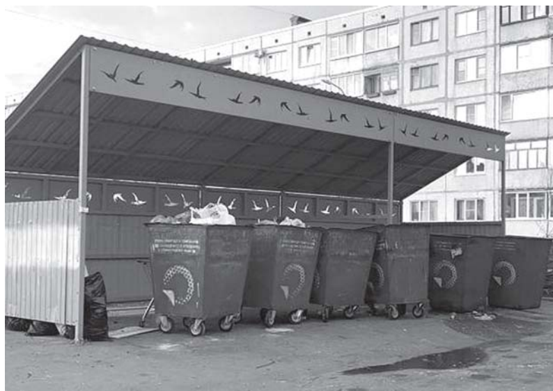
На площадке у магазина «Мир и мода» добавлены три дополнительных контейнера, чтобы не скапливался мусор.

Ещё в 2019 году перед региональным оператором по вывозу отходов стояла задача завершить договорную кампанию и составить полный реестр контейнерных площадок, а перед муниципалитетами - дооборудовать недостающие, но город развивается, и возникают вопросы о неуместности расположения некоторых мусоросборников. При решении об их