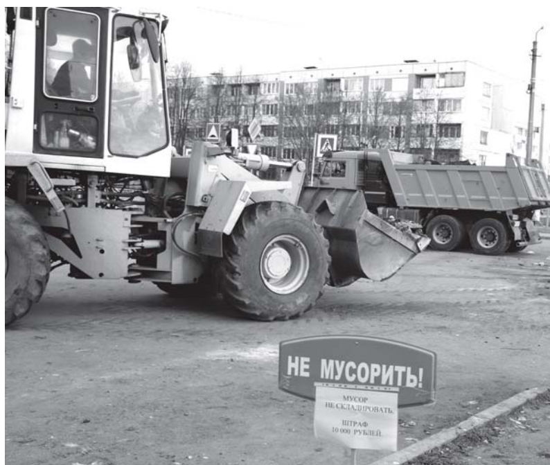
Работники МП ПРАУ на спецтранспорте очистили место около бывшей площадки на ул. Чапаева, 28.

переносе обязательно должны учитываться нормативы накопления ТКО.