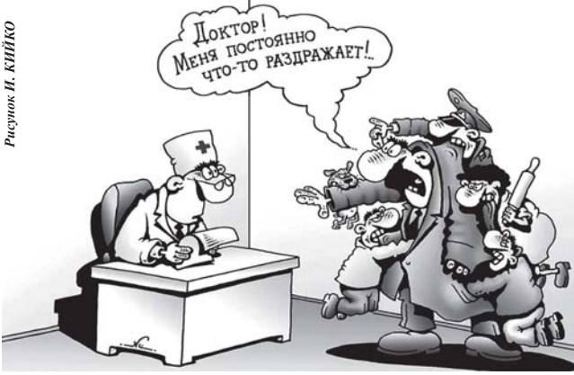
Рисунок И. КИЙКО

Буйабес - это нереально наваристый французский рыбный суп. Только не спешите сравнивать его с нашей традиционной ухой. У этого блюда приятный темно-желтый оттенок, а его аромат ни с чем не сравнится. Все дело в рецептуре. В супе должно быть столько сортов рыбы, сколько букв в оригинальном названии (bouillabaisse). В него также добавляют различные морепродукты.