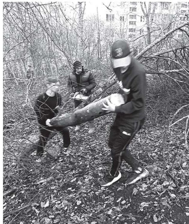
Мельниковские волонтеры-старшеклассники со своим руководителем на расчистке территории для детской горки.

- Мы очень довольны помощью молодежи! - сказали местные мамочки. - Наша детская горка