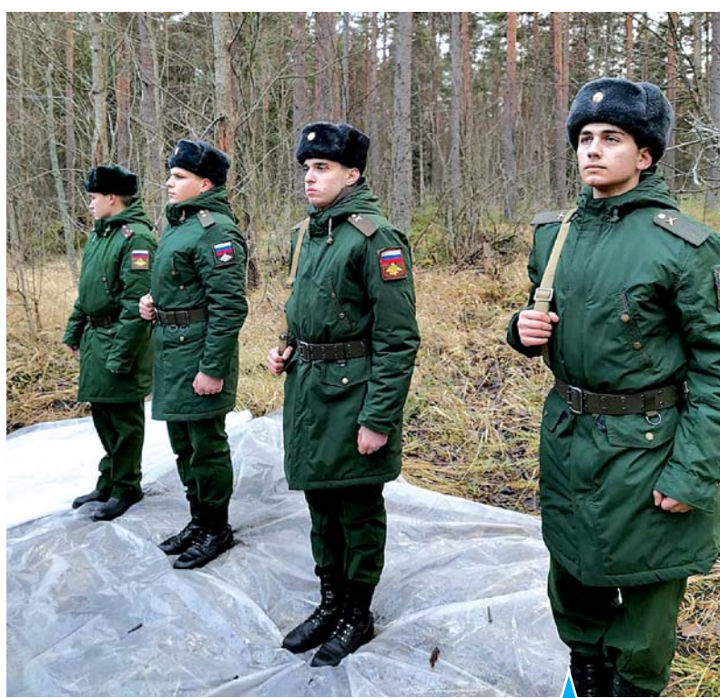
Торжественно-траурное захоронение бойцов Рабоче-крестьянской Красной армии, погибших в советско-финляндской войне.

Траншеи врага тянулись в 150 метрах от северного берега озера в районе поселка Келья (ныне пос. Портовое). Стрелковые части пошли в атаку ночью, и все шло хорошо, пока было темно, но наступление замешкалось, и, когда рас-