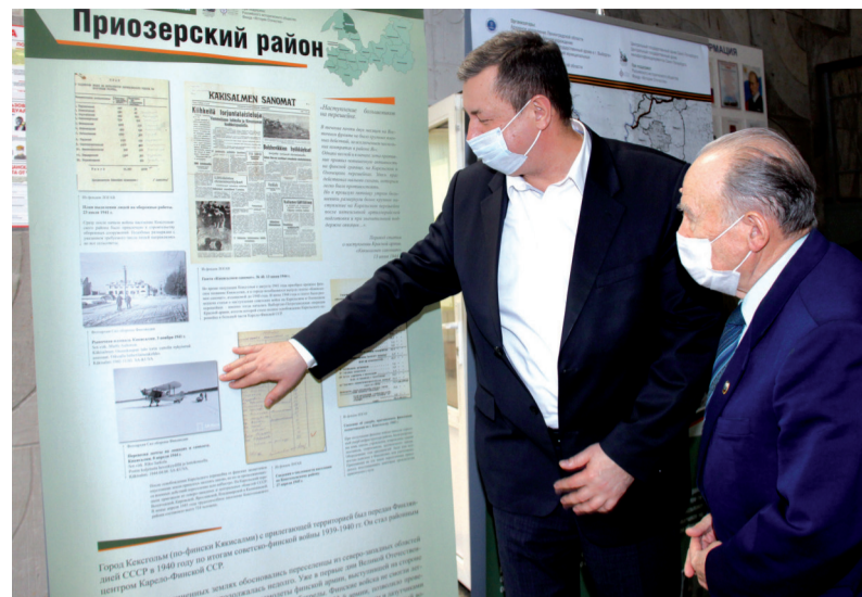
Историческая выставка в Приозерске