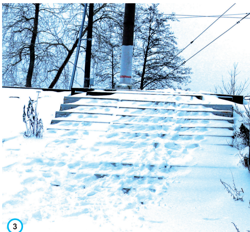
Опасный спуск от платформы № 1 по лестнице без перил рядом со спуском с платформы № 2.

С опережением графика на один день зима полноценно вступила в свои права. Снег, заносы - всё, как и положено. 30 ноября сотрудники ПРАУ начали чистить снег с 4 часов утра, поскольку метель не прекращалась, вышли убирать снег повторно в обеденное время.