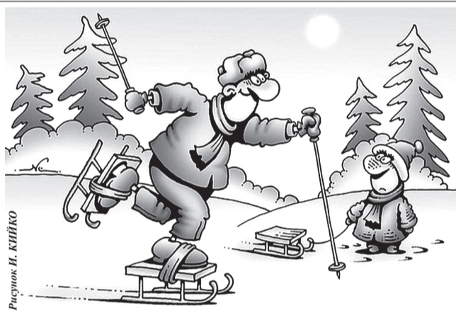
Рисунки И. КИЙКО

ЭТО ИНТЕРЕСНО Членам маленького африканского племени масаи надоело охотиться самим, и они решили, что гораздо проще будет просто внаглую отбирать добычу у львов. Мужчины становятся плечом к плечу и решительным быстрым шагом направляются к месту, где львы уже собрались подкрепиться свежешей добычей. Масай не кричат, не размахивают оружием, не делают никаких угрожающих знаков, но львы явно ошарашены и на всякий случай ретируются в кусты, оставив всё заработанное тяжёлым трудом.