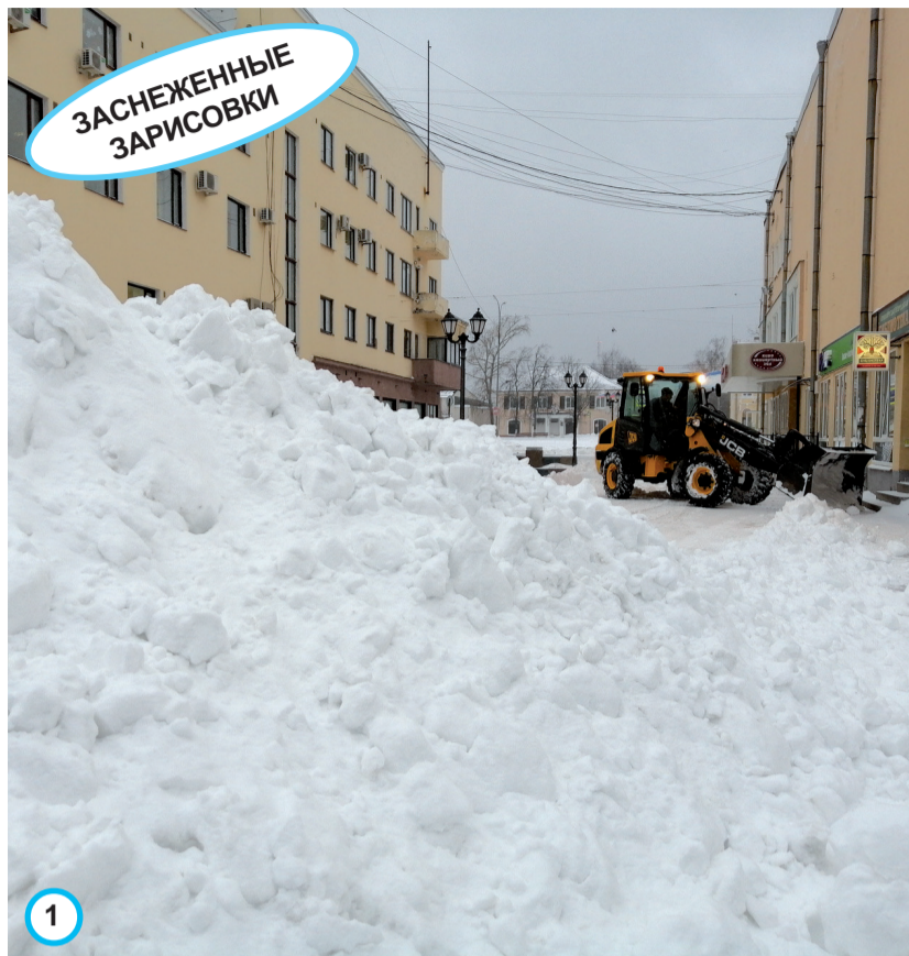
У киноконцертного зала вырос огромный сугроб выше человеческого роста.