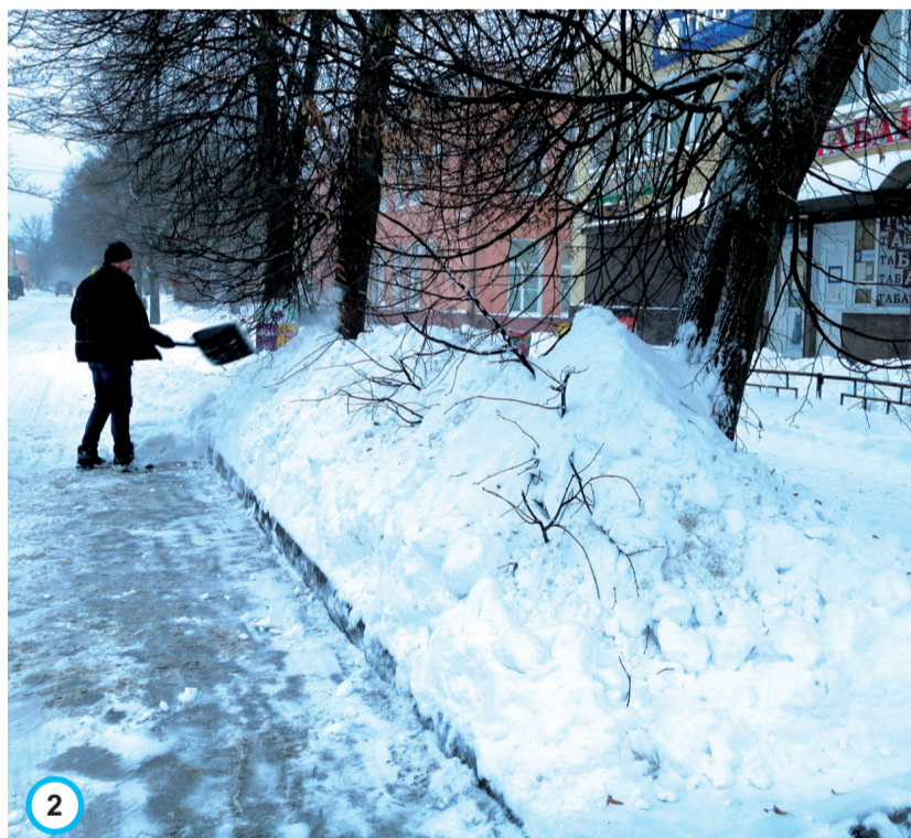
На ул. Жуковского сотрудники магазина по продаже бытовой техники старательно вычистили территорию.