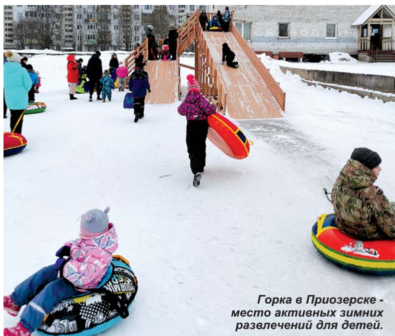
Горка в Приозерске - место активных зимних развлечений для детей.

В первые дни активного катания на горке в городе Приозерске стало очевидно, что многие ребяташки в азарте нарушают правила безопасности и рискуют получить травмы, забираясь на горку и скатываясь с нее самыми непредсказуемыми способами. Да и не все родители внимательно следят за своими детьми, а иные малыши и вовсе развлекаются без присмотра старших. В связи с этим ПРАУ опубликовало правила безопасности при катании с горок. Прочтите сами, расскажите детям, и приятных вам покатушек!