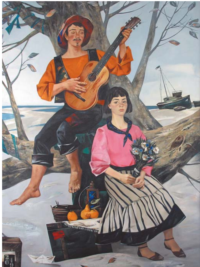
"Под музыку моря".

И. ДУБОВЦЕВА, куратор выставки Иллюстрации предоставлены автором