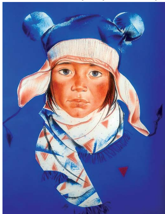
"Зима", 2018 г.