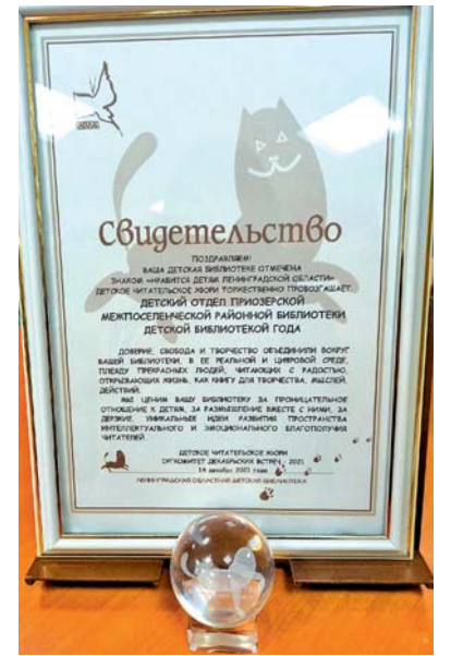
Знак «Библиотека года», врученный Приозерской детской библиотеке.