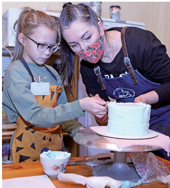
Дети с интересом украшали тортики.