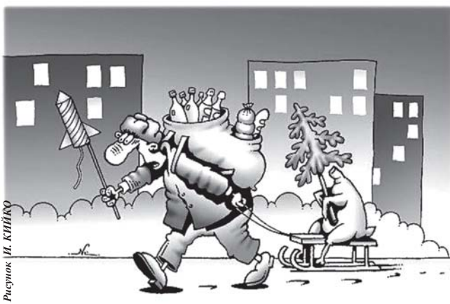
Рисунок И. КИЙКО

У песца самый теплый мех из всех животных Арктики. Зверь выдерживает температуру до -70°C. Песец принадлежит к роду лисиц, потому второе его название - полярная лиса. Длина тела - до 75 см, вес - от 3 кг.