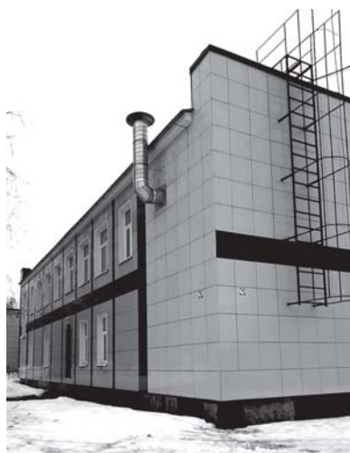
Восстановленный фасад здания клуба в пос. Ромашки.

Когда о случившемся узнали односельчане, они не могли поверить, что их земляки могут так себя вести. Ведь мужчины из благополучных семей, причем они довольно зрелого возраста. После проведенной сотрудниками полиции работы оба были привлечены по статье 20.1 КоАП (был взыскан штраф - по 500 рублей с каждого). В своих объяснениях они подтвердили