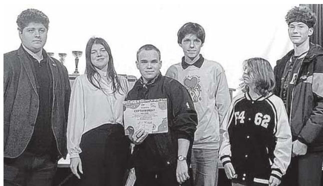
Команда Приозерска с руководителями областного турнира по дебатам.