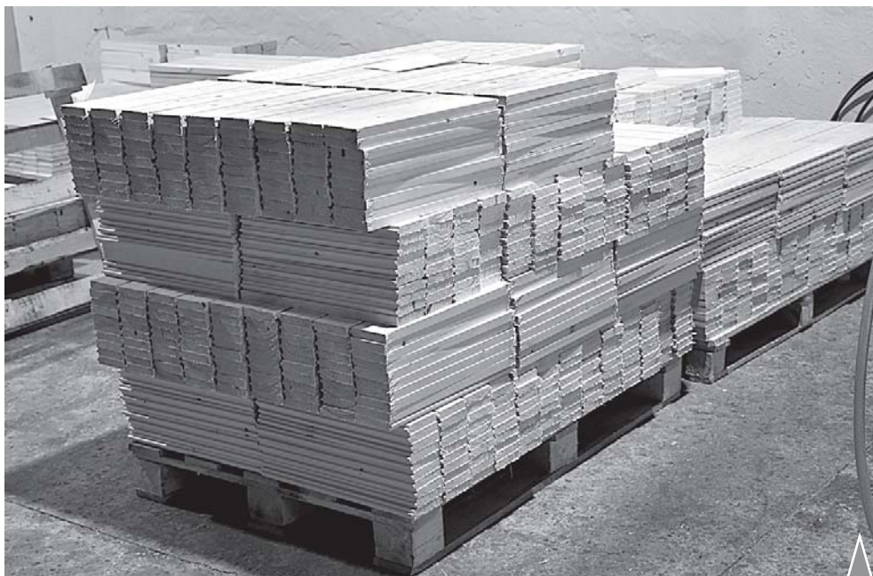
Заготовки для производства продукции ОАО «Лесплитинвест». На территории завода.