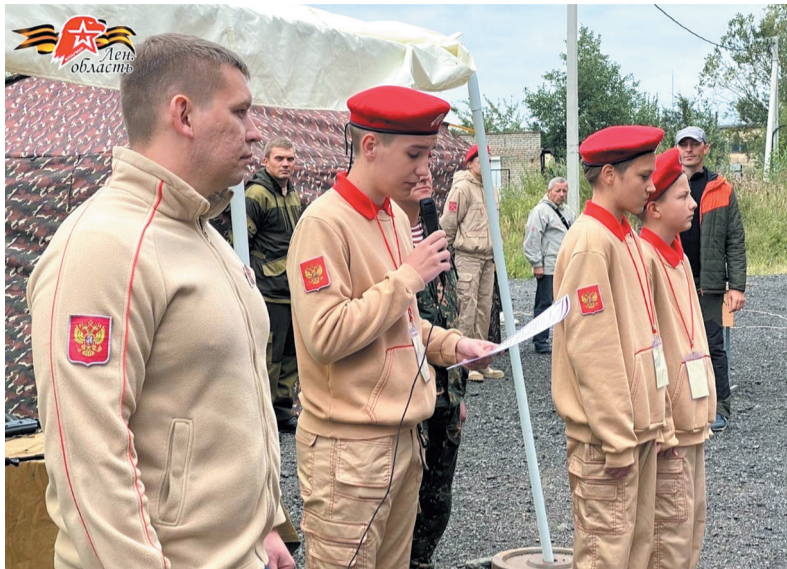
Сборы юнармейских отрядов «Валимский рубеж»