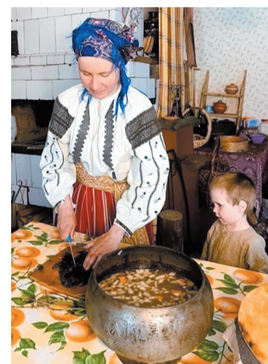
Волосовский район развивает агротуризм

раллельно читают лекции об истории Великой Отечественной войны. В Ломоносовском районе на средства гранта ресурсный центр «Профи» привлекает местных пенсионеров к нескудным мероприятиям и культурной жизни. Фонд «Ангел надежды» в Кингисеппе обеспечила детей-инвалидов доступом к редким тренажёрам