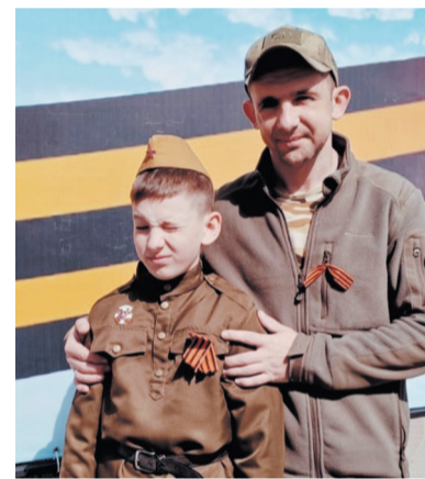
Своего сына Евгений растит настоящим патриотом

Во-первых, у меня был достойный опыт. Я служил по контракту в разведротте 138-й бригады возле Выборга. Во-вторых, были и личные причины пойти на СВО. Сам я родом с Украины. Мне не нравится, что поляки будут учить меня, как мне разговаривать, на русском языке или на