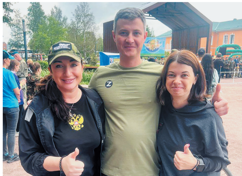
Движение волонтеров объединяет тысячи неравнодушных жителей Ленинградской области

ЮЛИЯ ЛИСНЯНСКАЯ