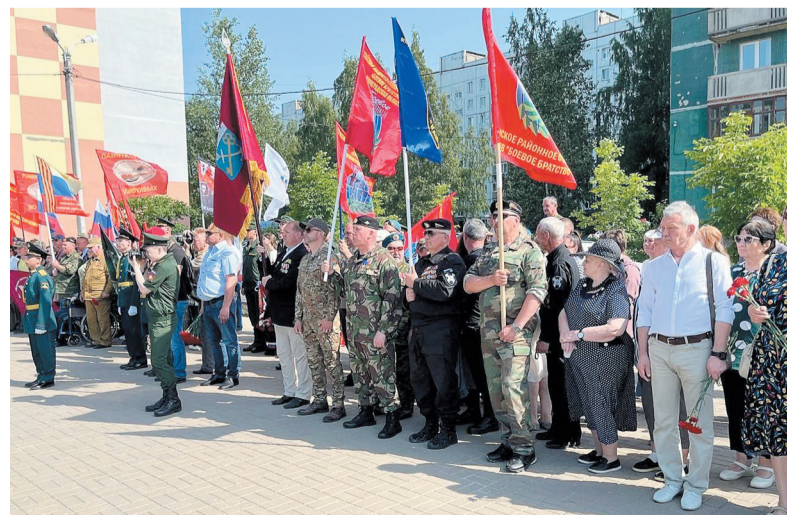
«Ленинградский тыл» сотрудничает с региональным отделением организации ветеранов «Боевое братство»