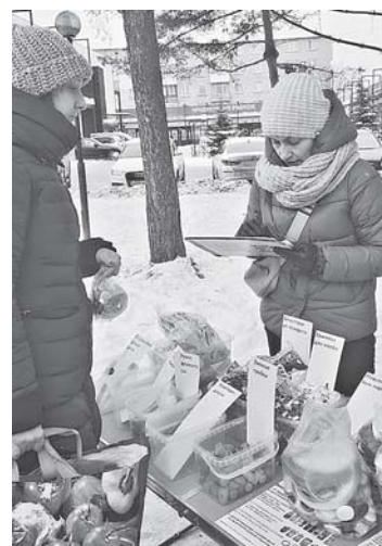
Раздельный сбор ТКО