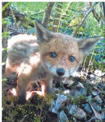
■ Маленький лисёнок в лесу

СКОРО МАРТ – САМОЕ РОМАНТИЧЕСКОЕ ВРЕМЯ У ЛИСИЦ И ЛИСОВИНОВ, ЗНАМЕНИТЫХ РЫЖИХ ХИЩНИКОВ