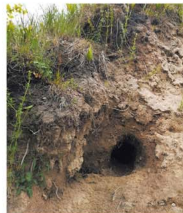
■ Лисья нора в Кургане Вещего Олега

Одна из первых задач для подросших лисят — найти место для норы. Особенно это важно для самок, ведь к началу брачного периода у них уже долж-