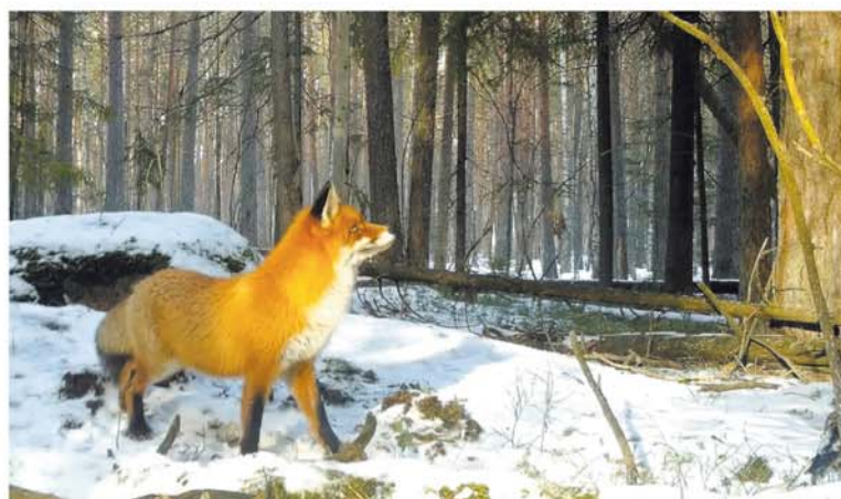
■ В марте месяце лисицы уже поджидают женихов для продолжения рода