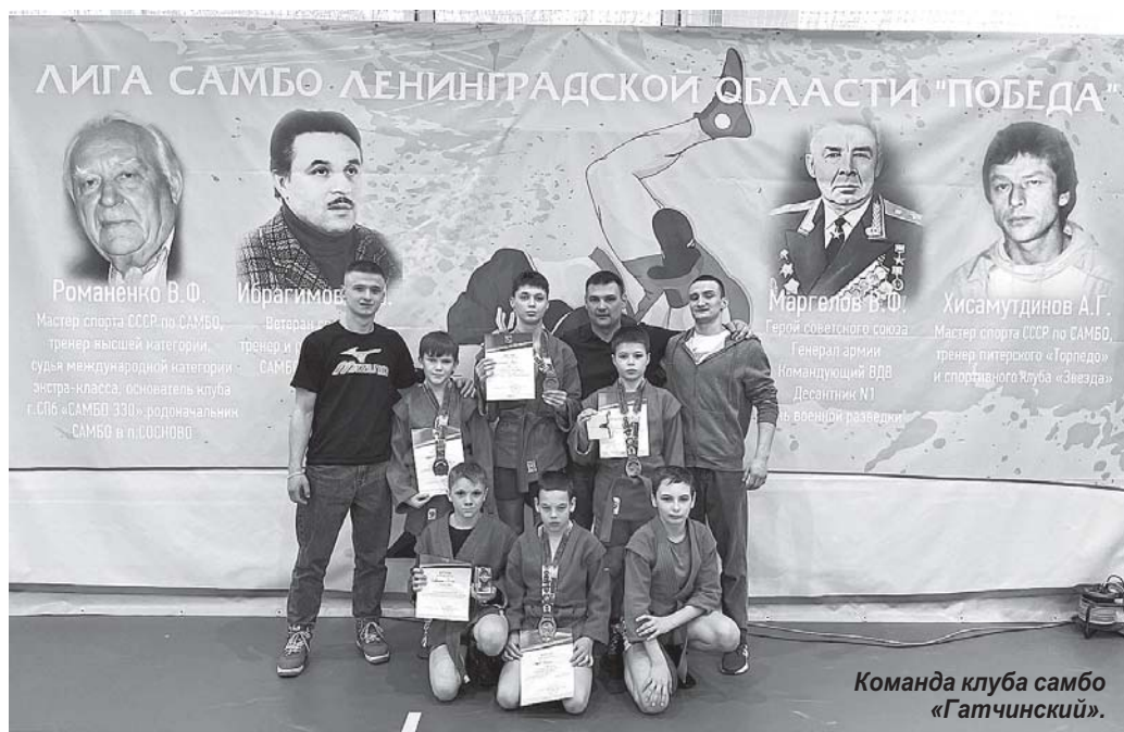
Команда клуба самбо «Гатчинский».