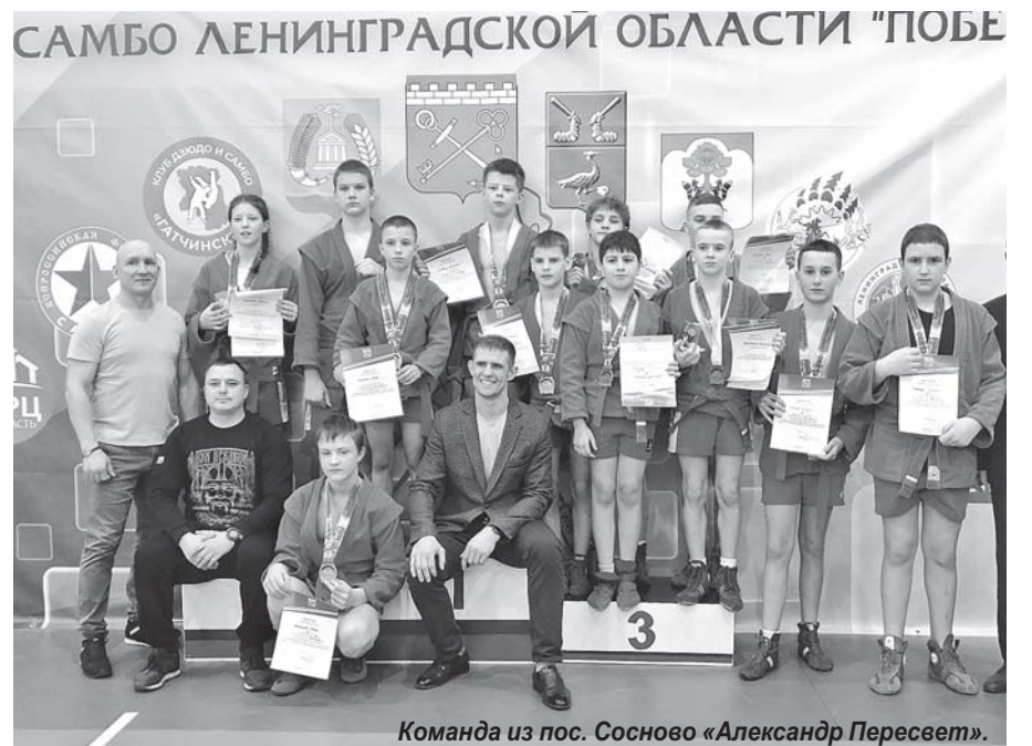
Команда из пос. Сосново «Александр Пересвет».