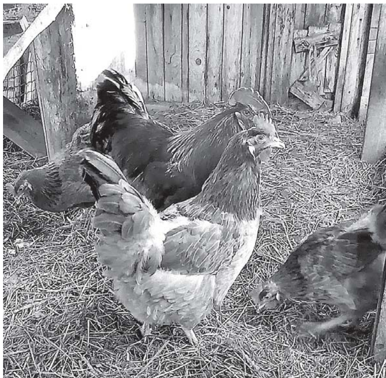
Украшение мини-фермы - куры.

Людмила ЛОГИНОВА Фото предоставлены автором