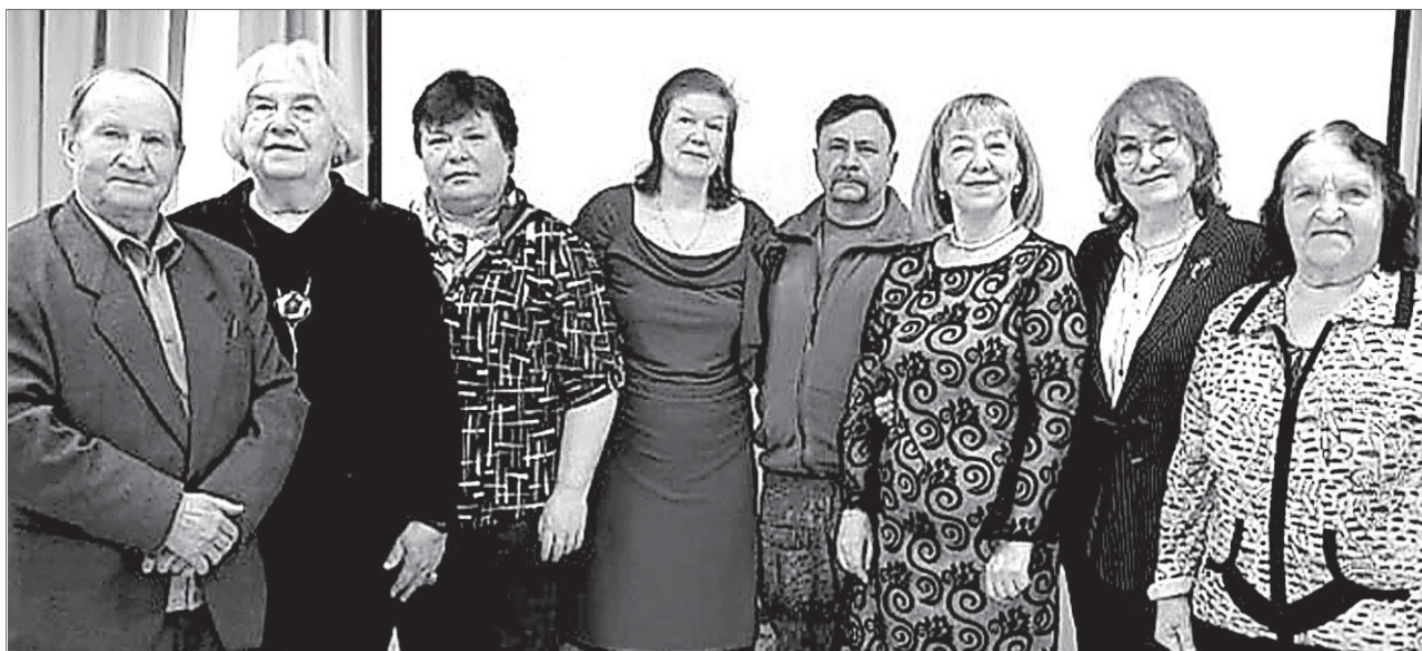
Коллектив центра «Наше наследие» на презентации нового альманаха в комплексном центре социального обслуживания.

собирается отметить 95-летие. Геолог-разведчик, ветеран труда. Ему присвоено звание «Почётный разведчик недр СССР». В творческой деятельности известен как писатель-публицист, создатель 37 руко-