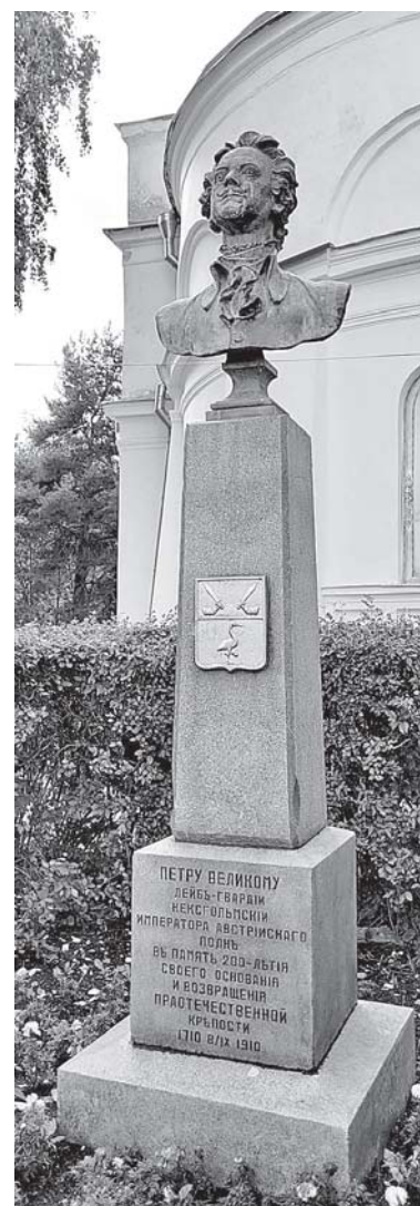
Бюст императора Петра I.

Судя по всему, город очень зеленый. Вдоль улиц выстроились ровные ряды деревьев и подстриженных кустарников. Сейчас, в апреле, зелени еще нет, но представить ее буйное великоле-